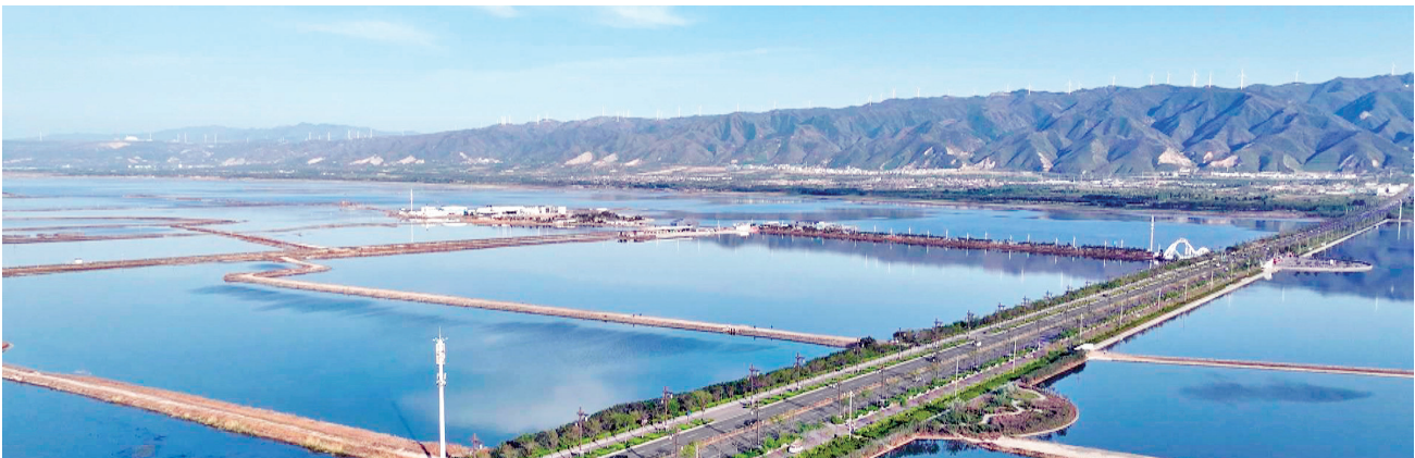
运城盐湖风光俯瞰

筑牢稳粮保供“压舱石”。 全面落实粮食安全政治责任，严守耕地保护红线，严格落实平衡管理。持续推进种业振兴、粮油单产提升、大豆玉米带状复合种植等行动，加大良种、良机、良法推广力度，实施吨粮村吨半粮田项目，新建育种、繁种基地2000亩。做好高标准农田管护，夯实农田水利基础，提升粮食综合生产能力，确保全区粮食播种面积稳定在50.5万亩以上，总产量3.13亿斤以上。 走好乡村产业“振兴路”。 坚持片区化开发、品牌化提升，加快做大做强蔬菜、水产、中药材等产业优势。持续打造梨、葡萄、西瓜、甜瓜、韭菜等示范基地，加快新品种、新技术、新模式推广应用。推进正晋牧业蛋鸡养殖、蔚时农业养殖等项目建设，支持海晟源、益大渔业养殖扩容，不断壮大畜禽及特色水产品养殖规模。加快食品产业园建设，推动农产品精深加工集聚