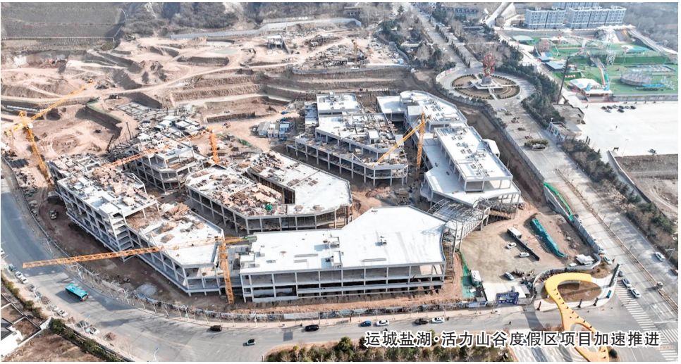
运城盐湖·活力山谷度假区项目加速推进