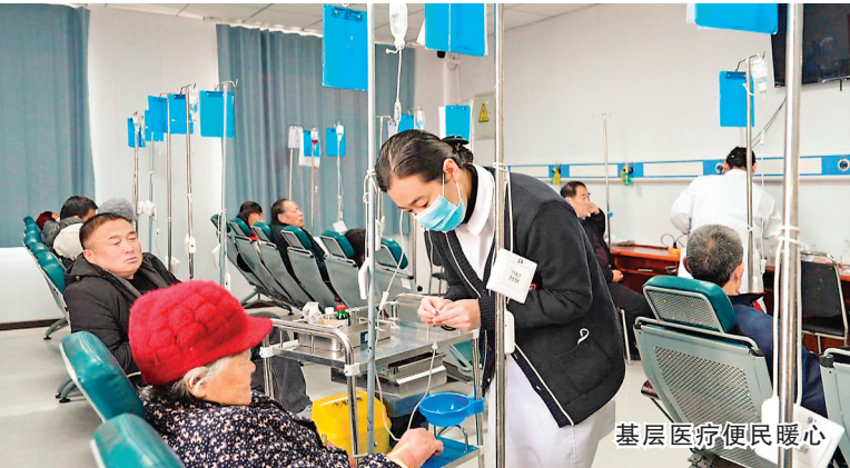
基层医疗便民暖心