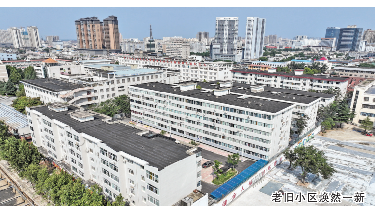
老旧小区焕然一新