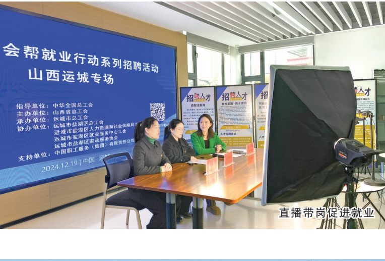
直播带岗促就业