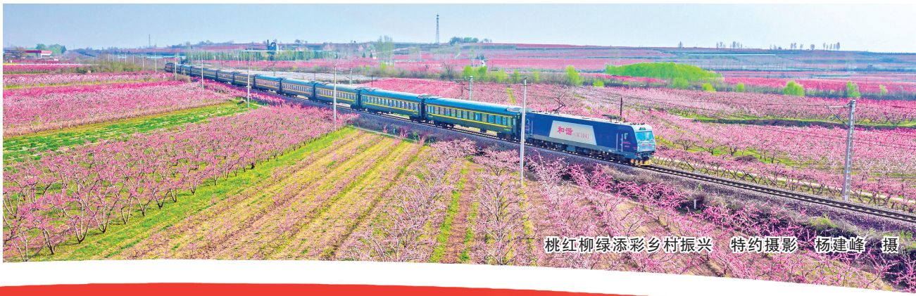
桃红柳绿多彩乡村振兴

力推消费提质增量。 大力实施提振消费专项行动，持续办好“遇见运城”消费季活动，优化电子消费券发放方式，进一步推动设备换代、汽车换能、家电换智。加快推进商业体系建设，强化万达广场、吾悦广场等核心商圈辐射带动作用，推动万方城购物中心、奥特莱斯商业小镇尽快建成运营，新打造15个星级“一刻钟便民生活圈”，争创县域商业“领跑县”。加紧培育消费新场景、新业态，更好满足群众多元化消费需求。 力推服务业业链补短。 增强生活性服务业的基础作用，鼓励万荣易家超市、荣河壹加壹超市连锁发展，成为本地产品的第一生力军。引入中高端酒店、餐饮品牌，丰富养老托育、护理养生、家政物业等服务供给。增强生产性服务业的引擎作用，推动先进制造业和现代服务业深度融合，围绕产业链上的科研创新、软件研发、检验检测、物流配送开发相关服务，加快推进国家骨干冷链物流基地建设，创新供应链金融、科技金融等产品，赋能新质生产力发展。 力推文旅产业持续出彩。 坚持以文引流、以旅聚势、以商增值，做好“人气、特色、高端”三篇文章。协同推进关公故里5A级旅游景区建设、运城盐湖国家级旅游景区创建，擦亮“关公”“盐湖”金字招牌。加快打造“南北呼应、业态互补”的旅游格局，实施舜帝德孝文化旅游景区提升改造，引入牵引性的文旅项目，点燃城市北部人气和活力；推进乐游天地、运城盐湖·活力山谷建设运营，引领沉浸式、体验式旅游新风尚；在解州谋划建设集文创、文创、美食于一体的综合商业中心，推广“四菜一汤一饼”地标美食、加大文物保护力度，加强历史文化遗址活化利用，推动文博、文创、文旅产业高质量发展。联动旅行社、线上旅游平台，推出更具创新活力的春游、夏游、秋行、冬享四季旅游产品，用“服务温度”延长“旅游热度”。