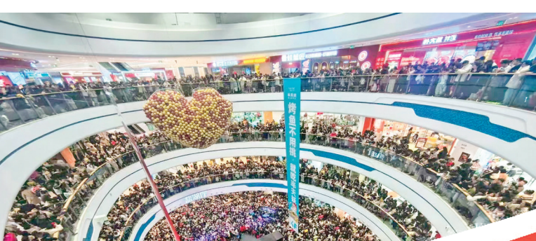
吾悦广场打造消费新地标