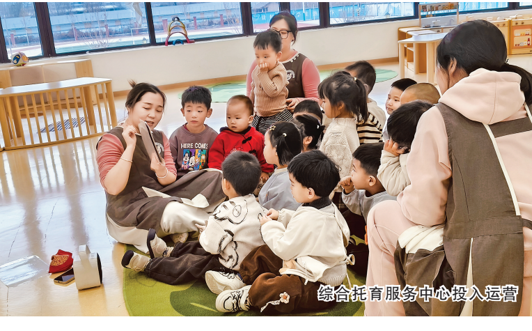
综合托育服务中心投入运营