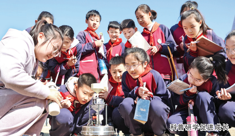
晋创谷·运城