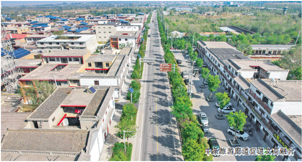
中条路沿路新建文明街景