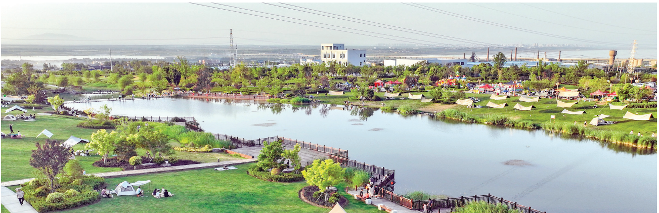
解州镇五坡成为游客打卡新地点

提升本质安全水平。 压紧压实安全生产责任，深入实施安全生产治本攻坚三年行动，扎实开展重点行业领域和人员密集场所安全隐患排查整治，严防重特大事故发生，减少一般性事故。强化食品安全全链条监管，守护群众“舌尖上的安全”。抓好森林防火、防汛抗旱、防震减灾、极端天气防范应对等工作。提高应急指挥、救援、物资保障能力，努力实现高质量发展和高水平安全的良性互动。 提升风险防范能力。 加强政府债务管理，用好国家和省债务置换额度，积极化解存量债务，坚决遏制新增隐性债务。稳妥防范化解金融、房地产等重点领域风险隐患，严厉打击非法金融活动，守牢不发生系统性风险底线。健全重大突发公共事件应急处置保障体系，严防极端事件发生。 提升基层治理效能。 以新时代党建引领基层治理示范区建设为牵引，不断加强和创新社会治理。坚持和发展新时代“枫桥经验”，深入推进信访工作法治化，加强矛盾纠纷预防调处化解。健全乡镇(街道)履行职责任务清单，增强乡镇(街道)服务管理能力。加强社会治安整体防控体系建设，依法严厉打击黑恶势力、电信网络诈骗等违法犯罪活动。发挥社会组织、人道救助、志愿服务团队作用，让城市发展更有温度。