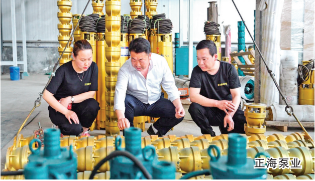
正海泵业

发展。发挥佳鑫食品、三馨食品等龙头企业带动作用，让农产品从“田间”到“车间”再到“舌尖”，实现充分增值。 绘就强村富民“新图景”。 严格落实各项强农惠农富农政策，持续巩固拓展脱贫攻坚成果，提高监测帮扶效能。支持滴灌农业等新型农业经营主体发展壮大，拓展“全程托管+村集体购买服务”等社会化服务模式。发展新型农村集体经济，完善联农带农机制，通过保底分红、入股参股、服务带动等方式，促进农民财产性收入增长。发挥乡村生态、文化领域独特优势，培育休闲采摘、生态康养、露营垂钓、乡村民宿等新业态，让农民的腰包更鼓、干劲更足、生活更红火。