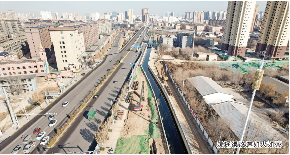
姚通集改造如火如荼