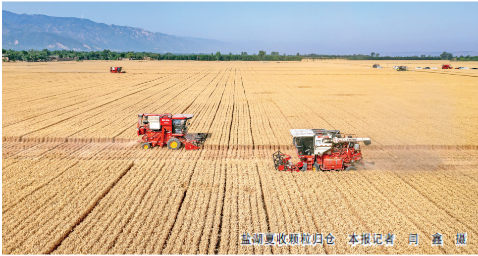
盐湖区丰收粮田

凝心聚力，共谱盐湖区发展华章；奋发有为，再除高质量发展宏图。3月19日至22日，运城市盐湖区第十七届人民代表大会第五次会议和政协第十五届盐湖区委员会第五次会议举行。会议审议通过政府工作报告系统总结盐湖区2024年工作，部署安排2025年工作，号召全区以习近平新时代中国特色社会主义思想为指导，全面贯彻党的二十大和二十届二、三中全会精神，深入贯彻落实习近平总书记对山西工作的重要讲话重要指示批示精神，特别是考察运城重要指示精神，落实中央、省委、市委经济工作会议部署，坚持稳中求进工作总基调，完整准确全面贯彻新发展理念，主动服务和融入新发展格局，扎实推动高质量发展，不断深化全方位转型，锚定“一城两区三门户”目标和思路，进一步全面深化改革开放，建设现代化产业体系，更好统筹发展和安全，稳定预期、激发活力，推动经济持续回升向好，不断提高人民生活水平，保持社会和谐稳定，高质量完成“十四五”规划目标任务，为实现“十五五”良好开局打牢坚实基础。