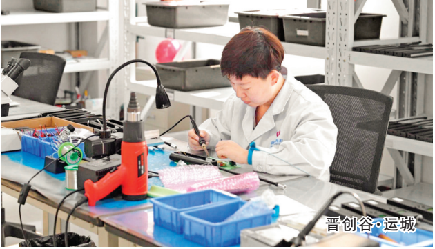
晋创谷·运城

提升城市功能品质。 深化山水城融合发展理念，治山、理水、营城一体推进，持续提升城市能级和核心竞争力。有序推进老旧小区和小街小巷提升改造，启动严子村安置房建设，全力做好姚东路贯通、学苑北延、山水城融合发展综合片区开发等城建项目征迁保障。推进国通521和盐湖高新技术产业开发区西外环路建设，提升互联互通能力。分步实施地下管网雨污分流改造源头治理，开展城市单元雨污错接混接治理改造。加快推进晋创渠、姚通渠提升改造，确保姚通渠汛期前通水，有效解决困扰多年的城市“内涝外患”问题。下足绣花功夫，深化城市治理，开展物业管理服务巩固提升行动，推进群众性精神文明创建，丰富城市文化内涵，培育城市“精气神”。 发展特色小镇经济。 加快编制乡镇级国土空间总体规划和村庄规划，科学布局生态、生产、生活空间，促进城乡产业发展、基础设施、公共服务一体化。聚力打造城乡融合节点，持续推进解州、东郭、北相特色小镇建设，不断增强服务城市功能、承接城市功能外溢、满足城市消费需求能力。立足资源禀赋和产业基础，一镇专注一业、一镇潜一品，加快构建各具特色、优势互补的城镇经济布局，不断增强乡镇发展内生动力。 建设宜居宜业和美乡村。 以“千万工程”为引领，全域谋划、系统推进，持续改善农村基础设施、公共服务和人居环境，加快推动乡村生态资源向美丽经济有效转化，争创“五好两宜”和美乡村试点。分类推进精品示范村、提档升级村建设，打造更多宜居宜业和美乡村。坚持塑形、铸魂并举，深化农村移风易俗，加强殡葬领域突出问题专项整治，塑造人居和谐、