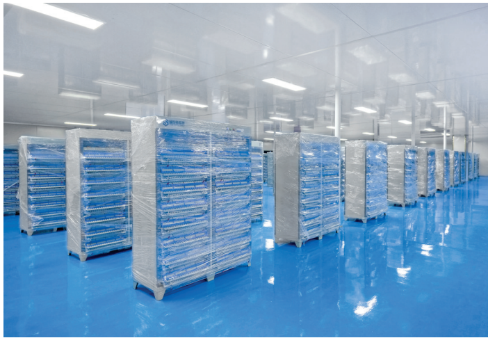
▲山西联畅新能源有限公司动力电池生产车间