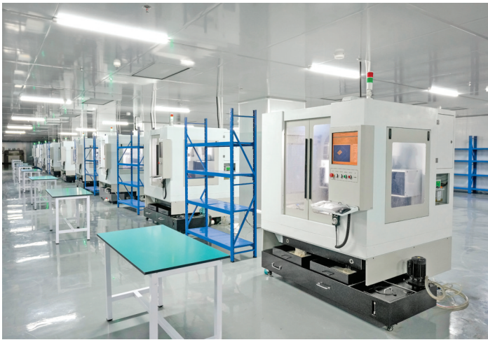
▲永济康泰电子科技有限公司生产车间