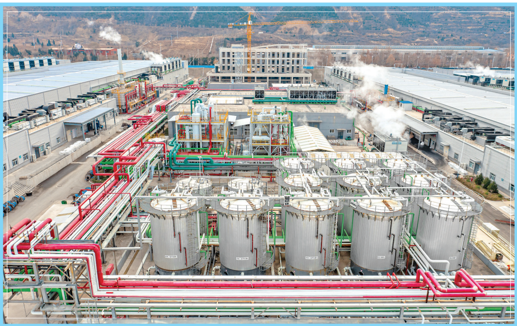
▲永济新能源电池产业园区