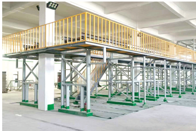
▲神舟电子高速耐腐蚀生产线项目