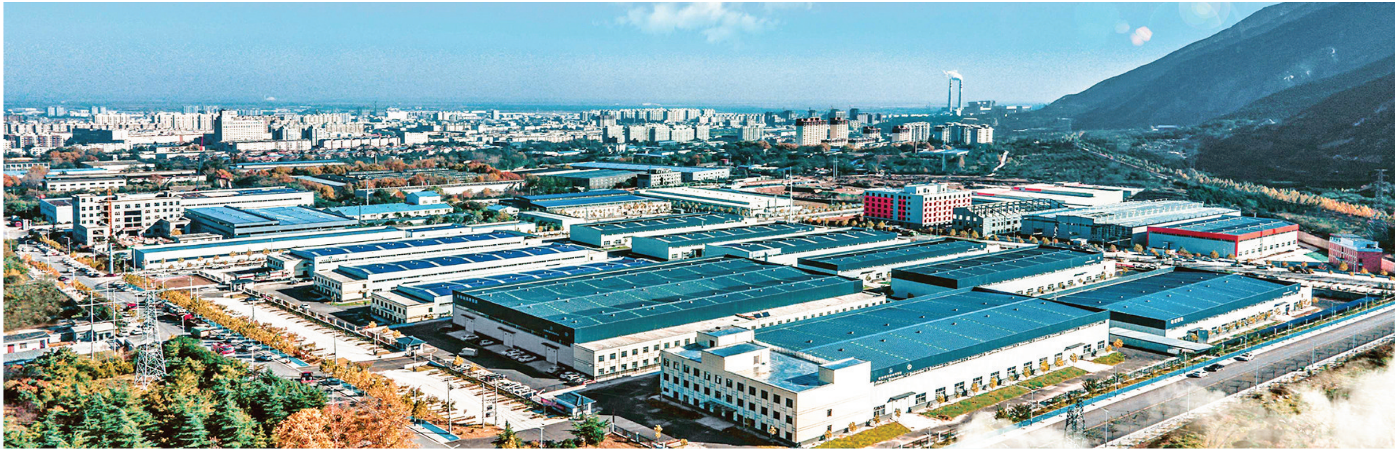
▲永济经济技术开发区建成二十三栋标准化厂房，总面积达十四万平方米，已入驻企业十八家。