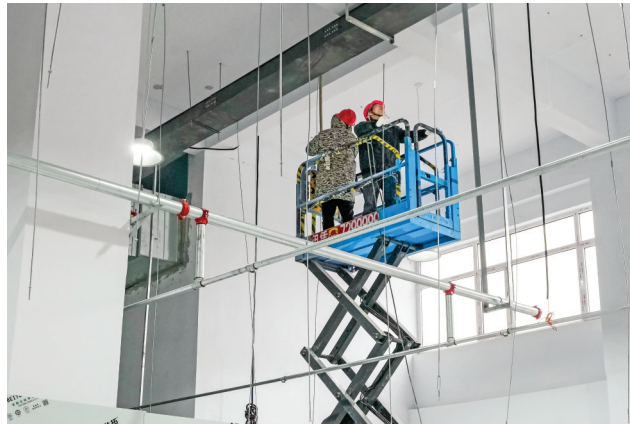
▲永济扬旗通信科技声学智能终端生产项目施工现场