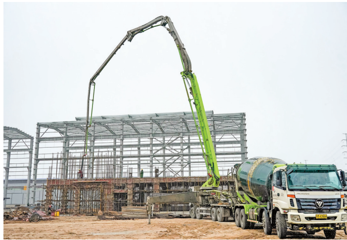
▲山西凯达新材料科技有限责任公司重点项目施工现场