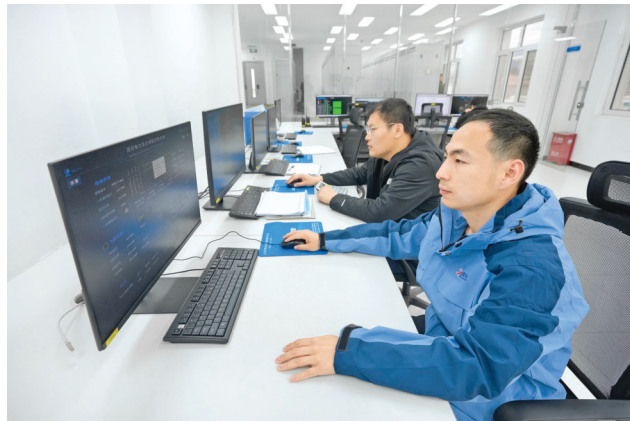
▲永济国云微控能源科技有限公司储能调频项目车间