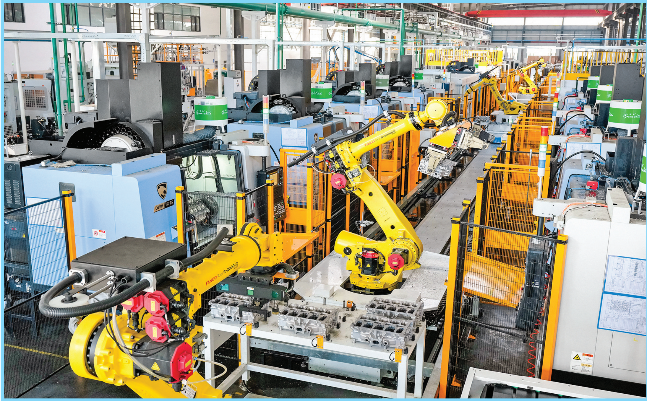
▲山西阳煤千军新能源汽车配件产业园生产车间

投资28.5亿元)、湖南中增能源5GW锂电池生产项目(总投资24.8亿元)、山东创瑞激光高质量增材制造智能装备基地项目(总投资10亿元)、常州百利磷酸铁锂正极材料研发与产业化项目(总投资5亿元)、深圳晟雄年产12000万只固态钠离子电池项目(总投资5亿元)、深圳互雅科技铝基铜覆板及LED全产业链制造基地项目(总投资5亿元)、山东康沃控股发动机及发电机组西北制造基地项目(总投资4亿元)、山西华供科技钙钛矿研发及中试平台项目(总投资1.5亿元)等招商引资项目正在加快对接沟通和落地步伐，为永济市工业的高质量发展蓄势赋能。