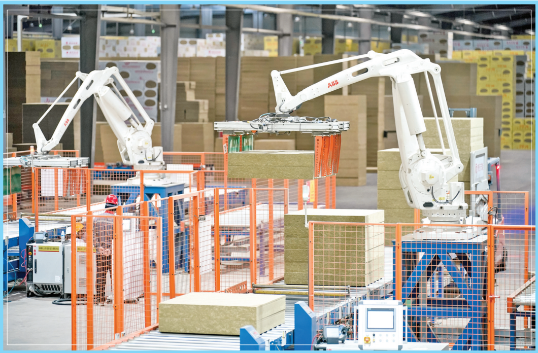
▲泰石节能(山西)有限公司生产车间