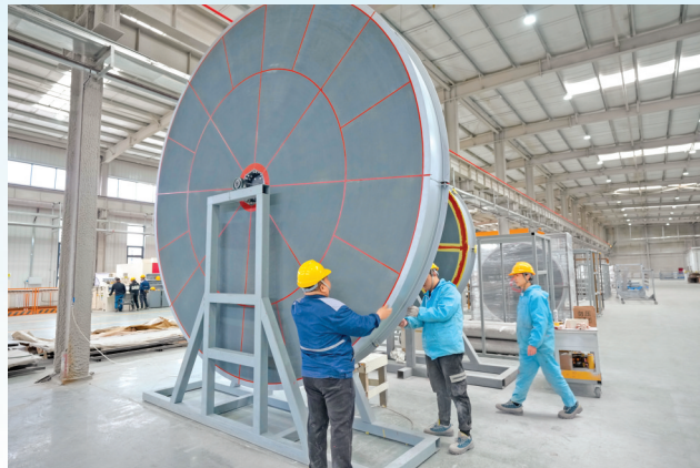
▲山西纳博科高性能环保新材料生产项目厂房