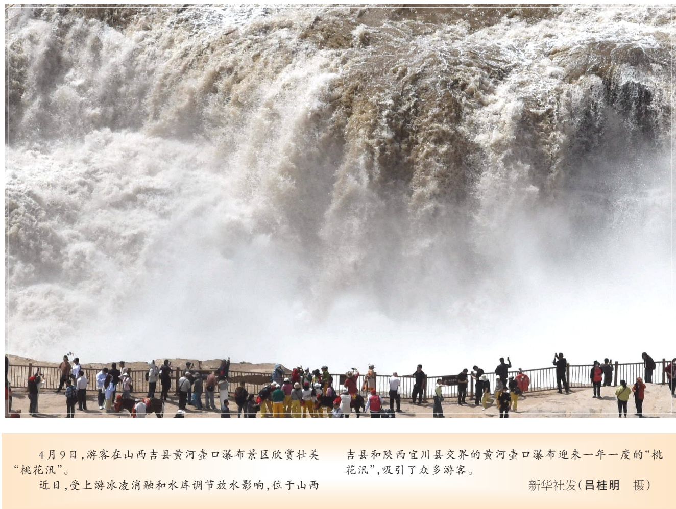
4月9日，游客在山西吉县黄河壶口瀑布景区欣赏壮美“桃花汛”。 近日，受上游冰凌消融和水库调节放水影响，位于山西

意见在完善食用农产品协同监管方面提出明确要求，提出了加强食用农产品产地准出与市场准入衔接。