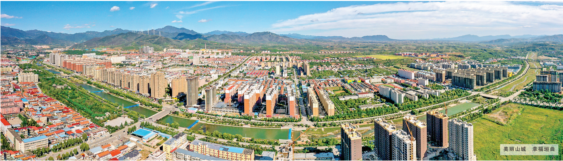
美丽山城 幸福垣曲