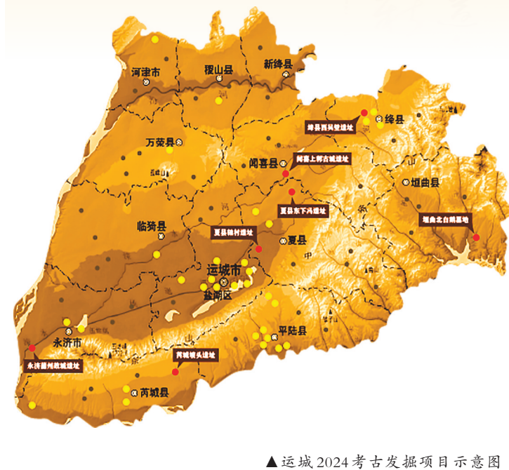
▲运城2024考古发掘项目示意图