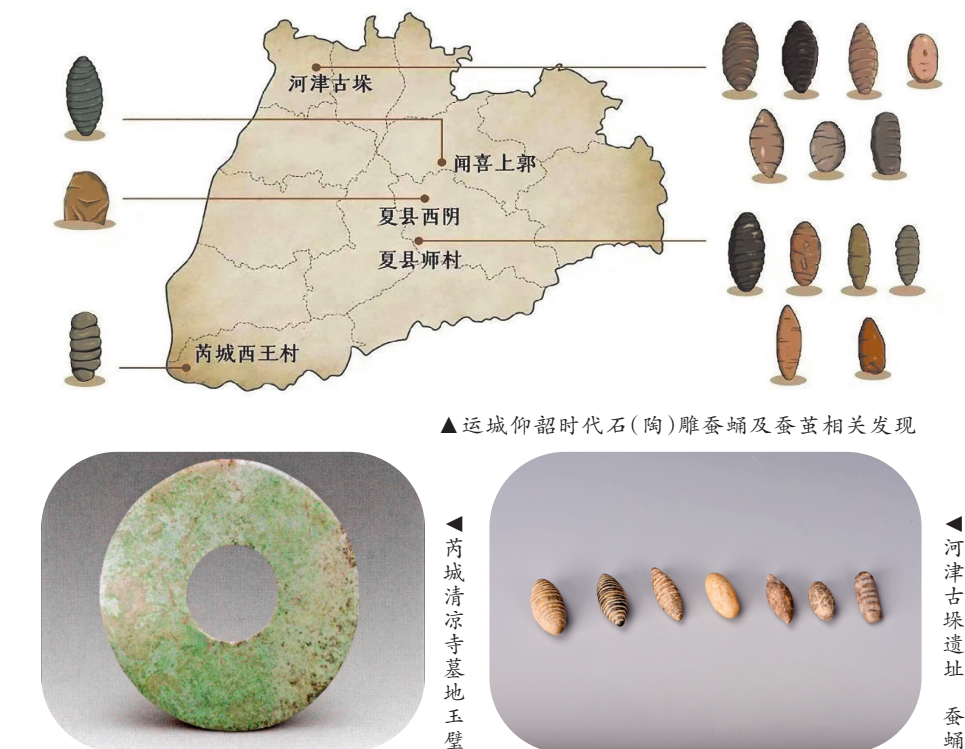
▲运城仰韶时代石(陶)雕蚕蛹及蚕茧相关发现

为深入贯彻习近平总书记考察运城重要指示精神，促进运城地区最新考古成果传播利用，讲好运城故事，深挖历史根脉，弘扬文化底蕴，我市特举办“寻根——运城最新考古成果展”。