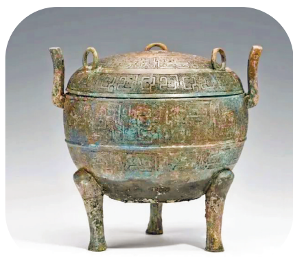
▲出土器物 闻喜上郭城址和邰家庄墓