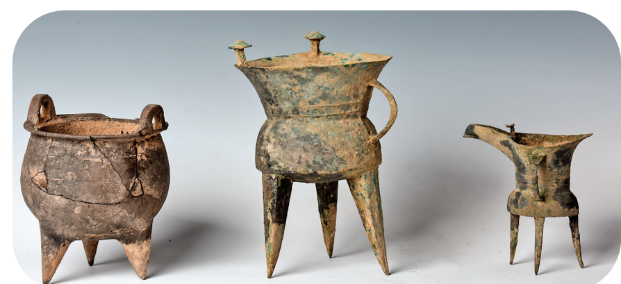
▲绛县西吴壁遗址 青铜礼器

青铜冶炼与铸造是夏商国家的政治灵魂，上层社会建构的宴饮礼乐与高端物质载体的完美结合，托举起了王国政治的经典路线。绛县西吴壁和夏县猗村早商大墓发现的青铜宴饮礼器，正是王朝政治在晋南的生动诠释。