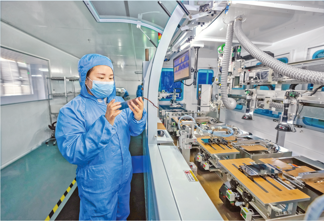
山西青华科云电子科技有限公司生产线及产品应用现场