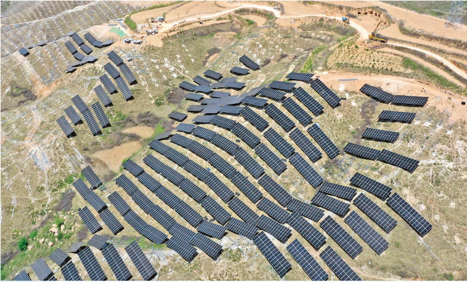
陕煤电力集团光伏发电项目