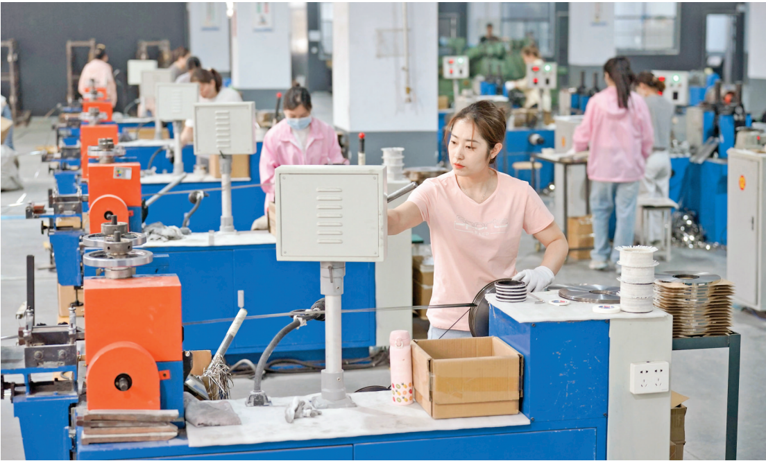
山西纳能科技有限公司生产线