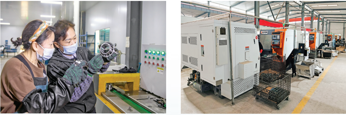
山西运诚轴承制造有限公司生产线