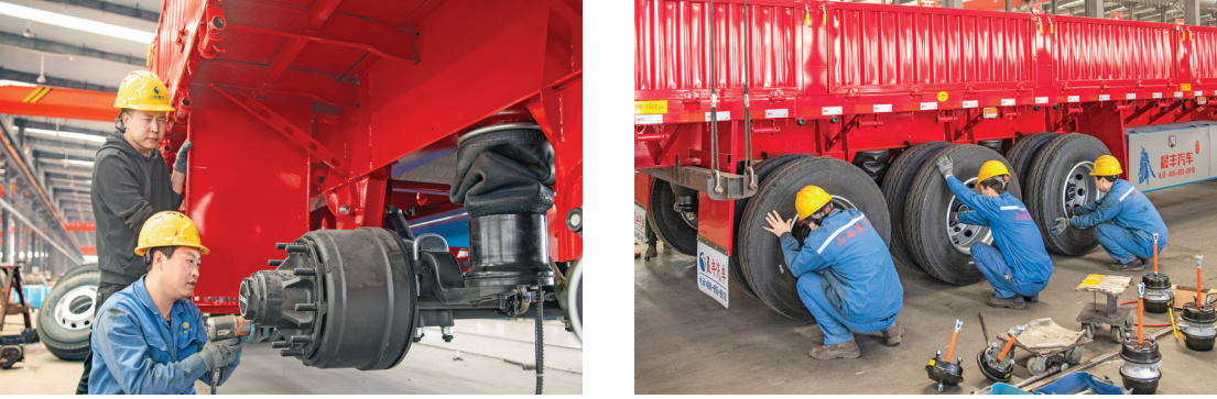
山西晨丰汽车制造有限公司生产基地