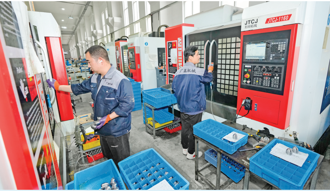
山西广鑫机械制造有限公司生产线

全力承接优势产业转移，是建设晋陕豫黄河金三角承接产业转移示范区的应有之义，更是提升我市发展能级、带动区域整体经济跃升、加快构建现代化产业体系的重要路径。 为贯彻落实市委“一城两区三门户”目标和思路，去年以来，夏县抢抓承接产业转移机遇，突出产业项目引导，聚焦装备制造、新能源、电子信息等战略性新兴产业，全力抓招商、引项目、建平台、强链条，着力打造转移产业集聚区，推动夏县现代产业迈向高质量。