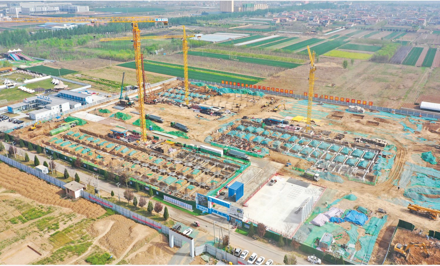
中建集团地下空间有限公司重点项目施工现场