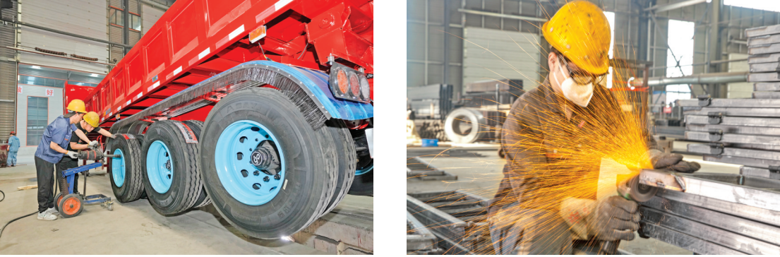
山西畅达科技实业有限公司生产基地