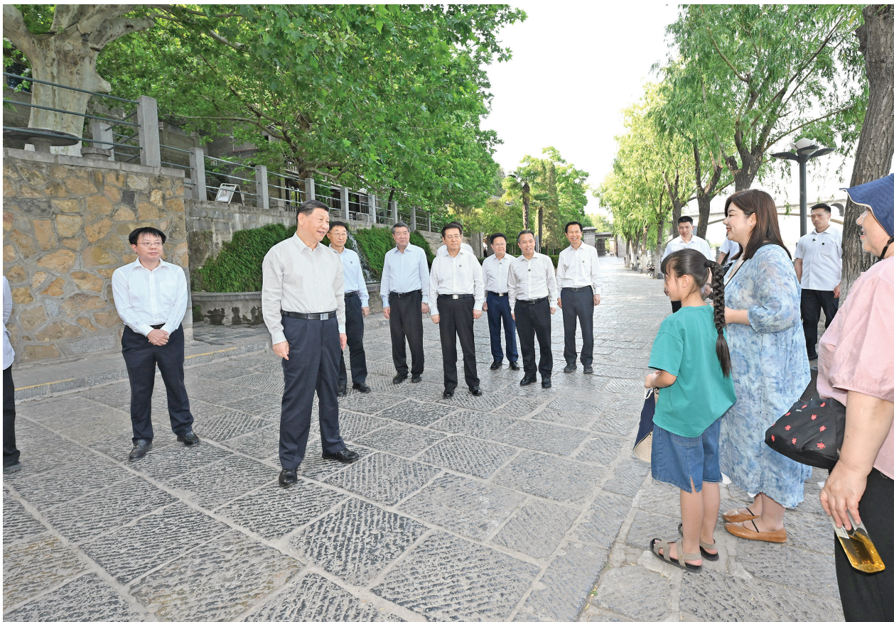
5月19日至20日，中共中央总书记、国家主席、中央军委主席习近平在河南考察。这是19日下午，习近平在洛阳龙门石窟考察时，同游客亲切交流。

新华社郑州5月20日电 中共中央总书记、国家主席、中央军委主席习近平近日在河南考察时强调，新时代新征程，河南要认真落实党中央关于中部地区加快崛起、黄河流域生态保护和高质量发展等战略部署，坚持稳中求进工作总基调，全面深化改革开放，着力建设现代化产业体系和农业强省，着力改善民生、加强社会治理，着力加强生态环境保护，着