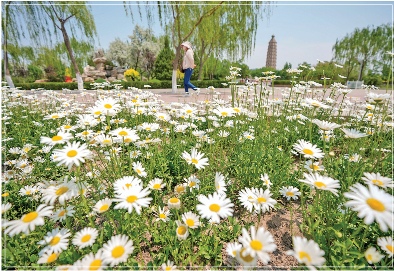
5月25日,游客在宁夏银川市海宝公园游玩。入夏以来,银川迎来晴好天气,城中湿地、公园构成一幅夏日湖城美景图。