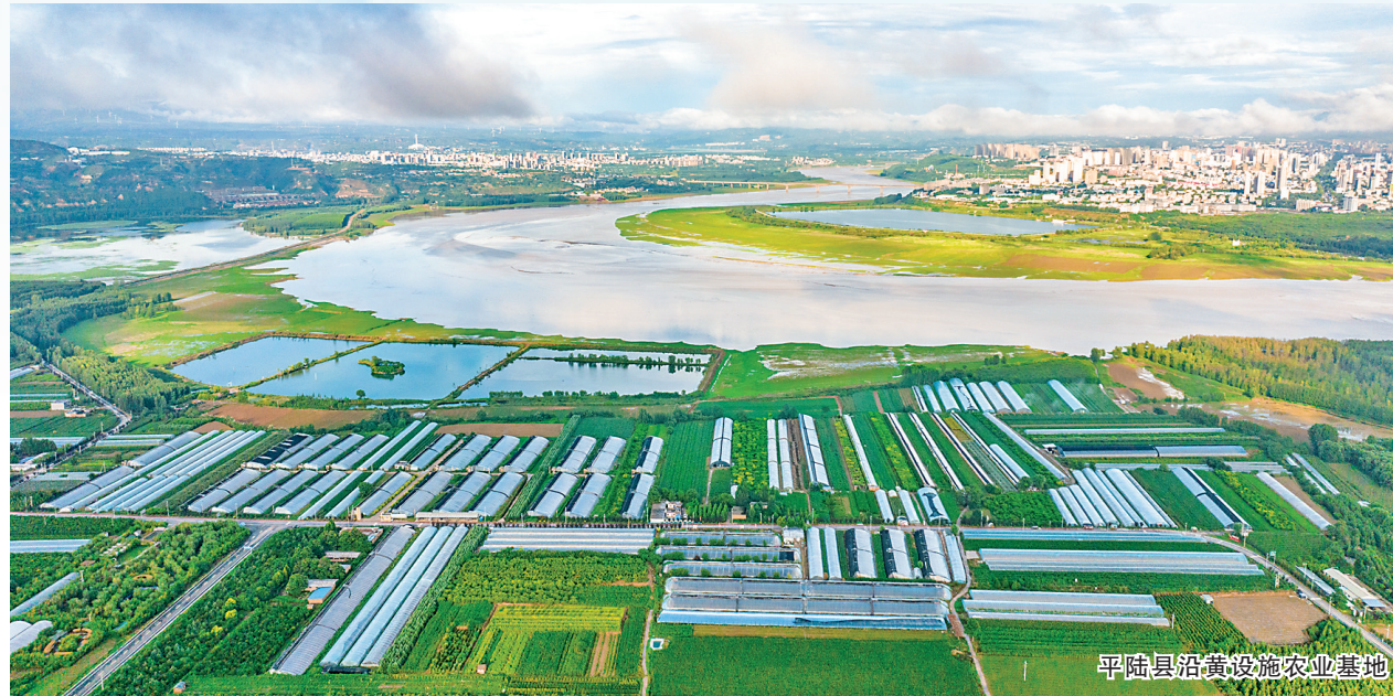
平陆县沿黄沿滩农业基地