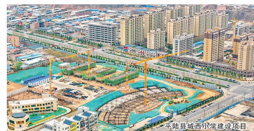
平陆县城西小学建设项目