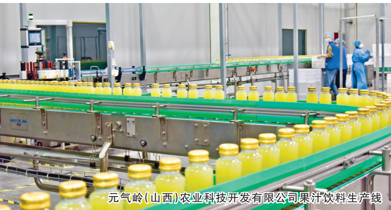
元气岭(山西)农业科技发展有限公司果汁饮料生产线