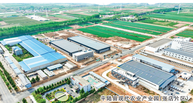
平陆县现代农业产业园(张店片区)