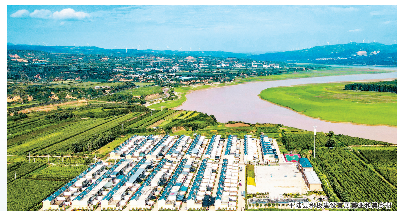
平陆县积极建设宜居宜业和美乡村

围绕“铝精深加工产业链”,积极上马投资100亿元的稀有金属绿色科技产业园项目,实施碳酸锂、硝酸钾、金属铍等稀有金属提取生产线,打造循环经济产业园区;汽车新材料产业园围绕“新能源汽车产业链”,以晨虹年产200万台套新型汽车内饰材料项目为龙头,对接川洋(山西)科技智能家居园,加快标准化厂房建设,配套上下游企业,争取更多企业落户园区,不断做优产品、做响品牌,实现产业集群化、集成化、集约化发展。 文旅产业曾是平陆县的弱势产业,近年来也从无到有、由有向优。平陆县聚焦创建全域旅游示范县目标,大力宣传“游黄河湿地、看天鹅戏水、逛黄土高坡、享田园风光、登森林公园、揽河东胜景”的文旅品牌,先后完成13个全域旅游项目建设,县城三大公园建设有序推进,杜马乡东坪头村入选全省乡村旅游重点村名录,积极推动风口山国家级森林公园养试点基地建设,风口凉都品牌叫响晋陕豫黄河金三角。