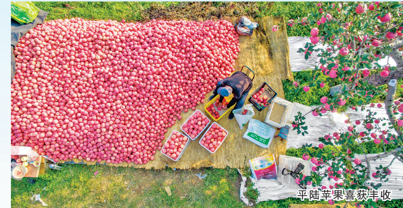
平陆苹果喜获丰收