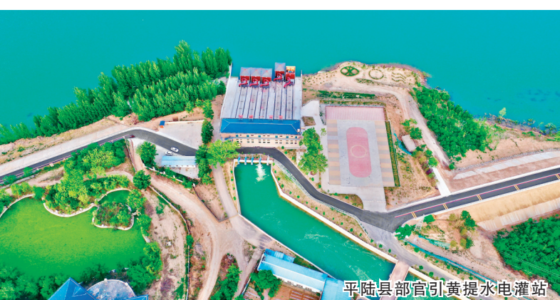
平陆县部官引黄提水水电站