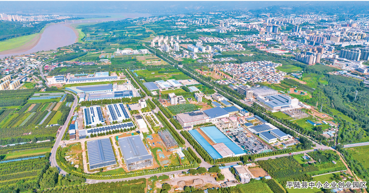
平陆县中小企业创业园区