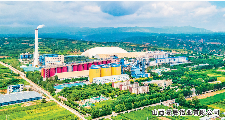
山西复垦铝业有限公司