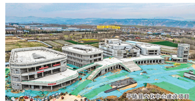
平陆县文化中心建设项目