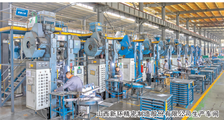
山西新环精密制造股份有限公司生产车间