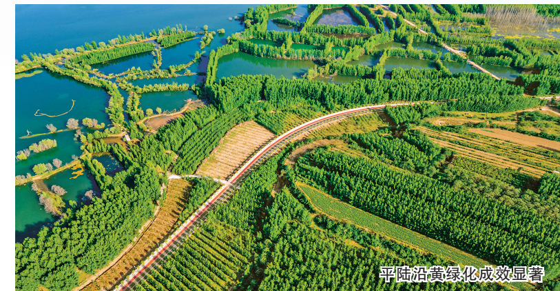
平陆沿黄绿化成效显著