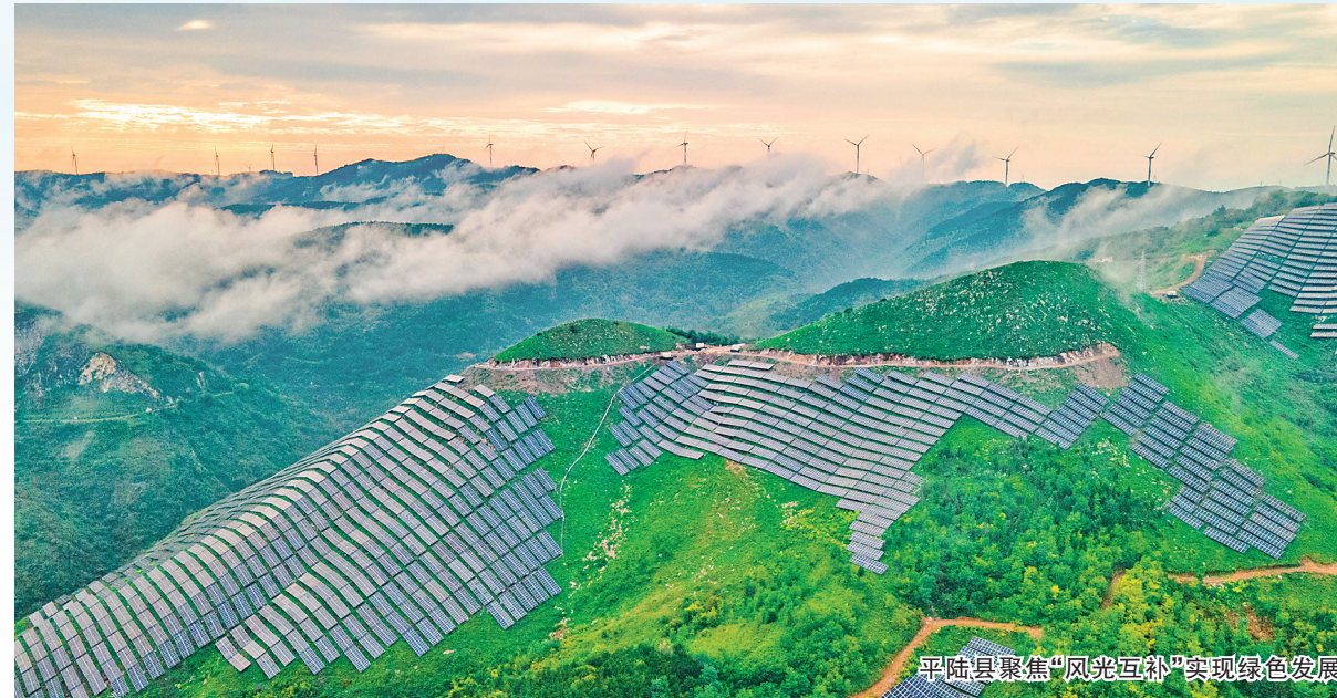
平陆县聚焦“风光互补”实现绿色发展