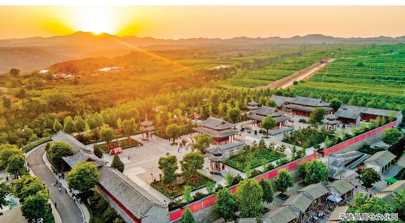
平陆县县仓文化园