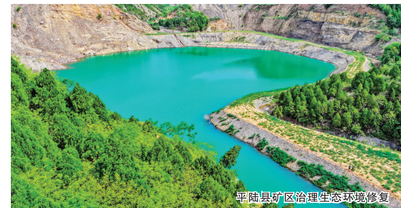
平陆县矿区治理生态环境修复