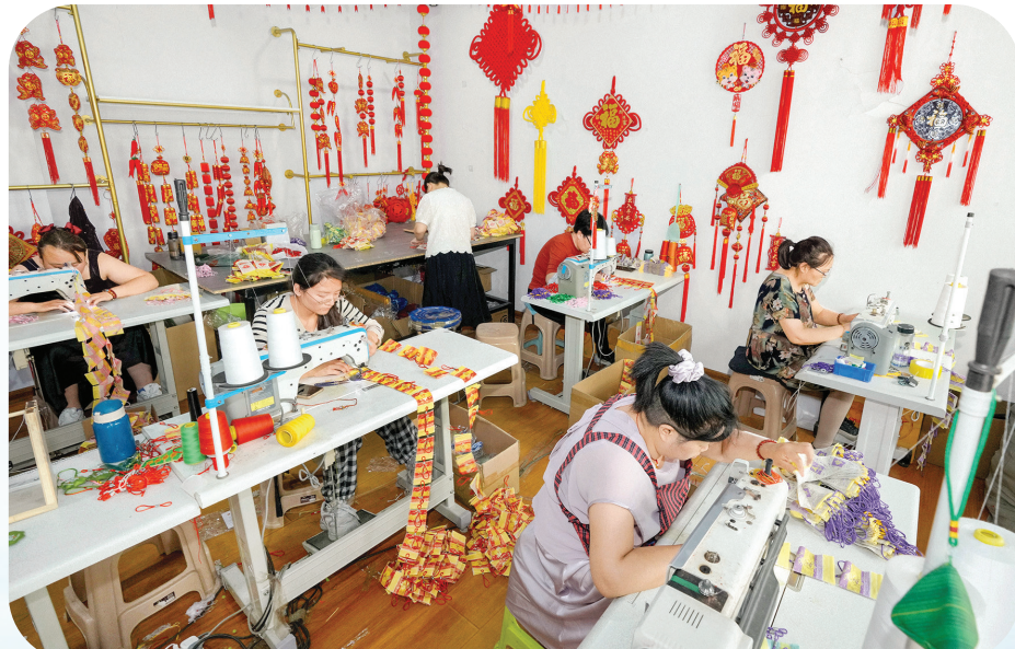
社区产业孵化园助力群众就近就业促增收