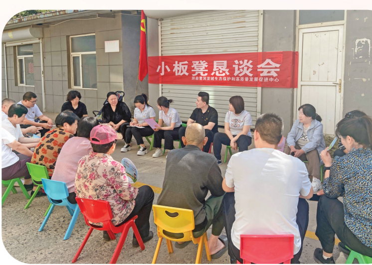
“小板凳恳谈会”搭建党群“连心桥”

在“议题破题”实践中，垣曲县委建立了党委（党组）书记项目库，将党建述职“必答题”、村级运转“15条”等纳入攻坚清单。历山镇党委书记领办“蜂巢专业镇党建联盟”项目，整合8个村党组织资源，建成标准化养殖基地5个，带动200余户蜂农增收40%；古城镇党委书记破解“飞地经济”发展瓶颈，通过跨村联建党组织，盘活闲置农房40余处，打造“古城渔村”旅游品牌，村均集体经济收入突破20万元。这些“书记工程”的落地生根，彰显“抓党建就是抓发展”的治理逻辑。 从三级联动的组织创新到未梢治理的精准施策，从服务阵地的亲民改造到制度体系的立柱架梁，垣曲县的基层治理实践，生动诠释了新时代“枫桥经验”的丰富内涵，展现了党建引领基层治理的多元可能。正如垣曲县委书记史玉江所设想的基层治理目标：以党建“红心”让民生“暖心”，用治理“精度”提升幸福“温度”，让每个基层组织细胞都充满活力，让每个角落都彰显文明，让党的执政根基如磐石般坚不可摧。