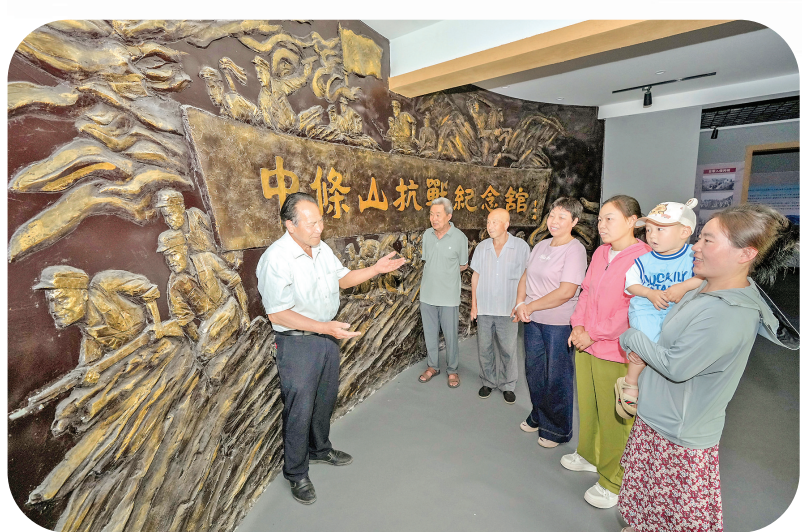
群众在中条山抗战纪念馆参观学习