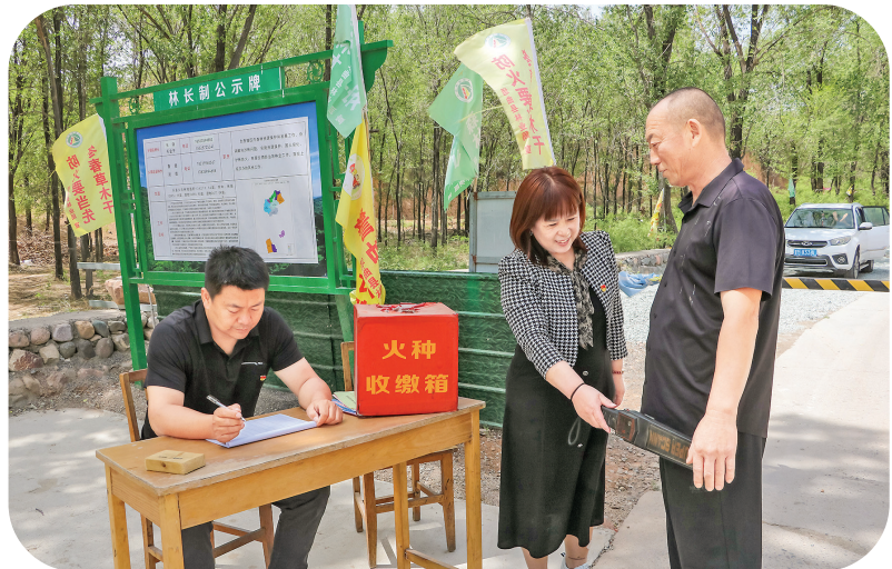
森林防火卡口党员先锋值班值守