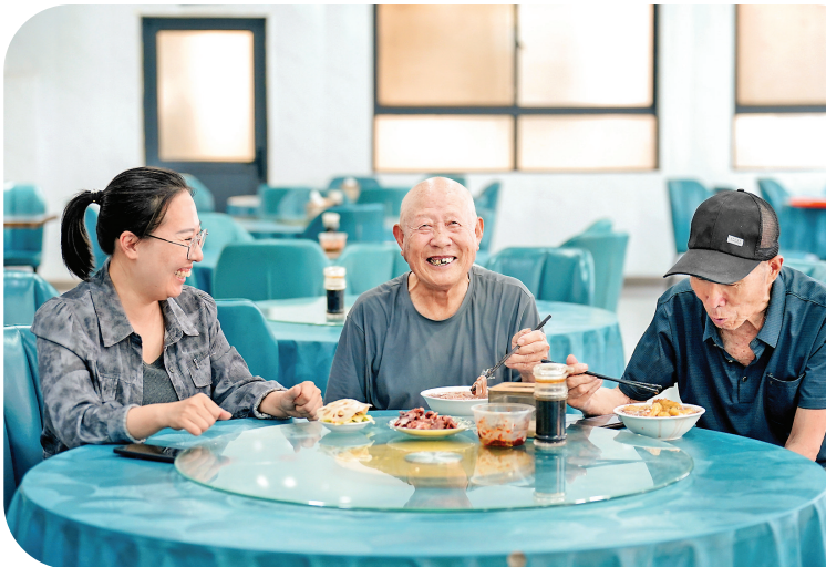
社区食堂周到服务惠民生