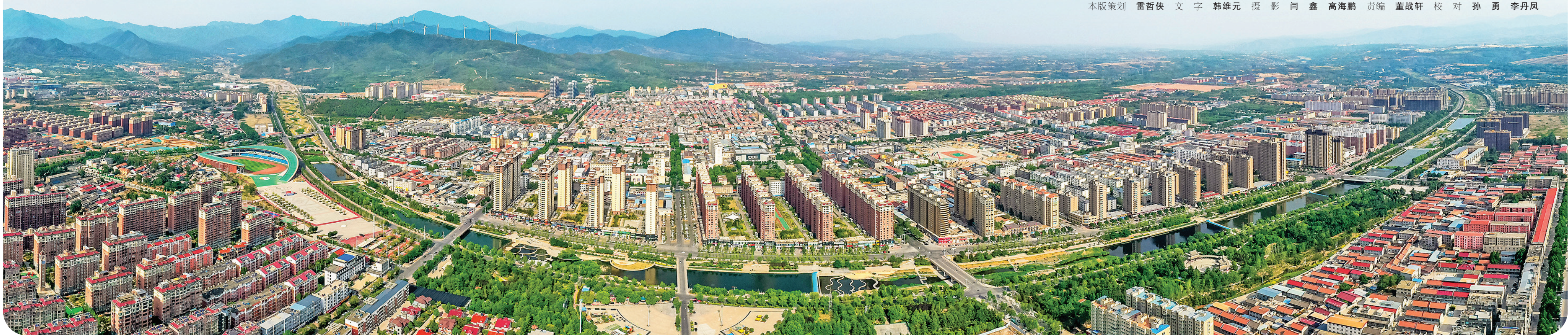
本版策划 雷哲侠 文字 韩维元 摄影 闫鑫 高海鹏 贾编 董战轩 校对 孙勇 李丹凤