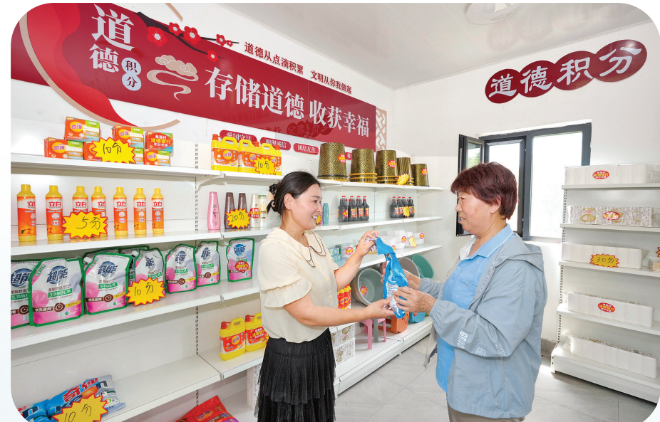
创设“德善积分馆”引导群众崇德向善

园”带动集体和群众“双增收”。这种“沉浸式”的议事模式，让领导意志与群众自治保持同频共振，真正实现“党群同心、共建共享”的基层治理目标。