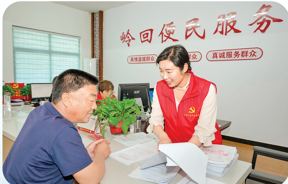
乡村便民服务大厅畅通服务群众“最后一公里”

等问题37件。更值得关注的是14个“爱心驿站”和1个“货车司机之家”，在为户外劳动者提供热饭饮水、歇脚充电等暖心服务的同时，也成为城市温情的流动注脚。 去年以来，在蒲掌乡的村落巷道里，一场打破传统会议模式的“围炉夜话”正在重构基层民主范式，成为垣曲县创建新时代党建引领基层治理示范区最温暖的注脚。当星光点亮屋檐，乡村两级干部与群众围坐畅谈，通过建立“夜访、夜议、夜办”闭环机制，探索形成了具有蒲掌特色的党建引领基层治理新路径。