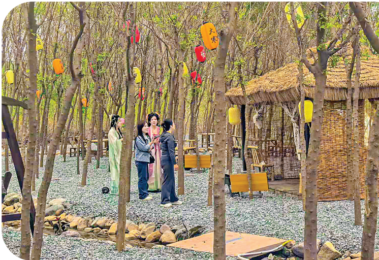
户外露营基地释放基层治理效能