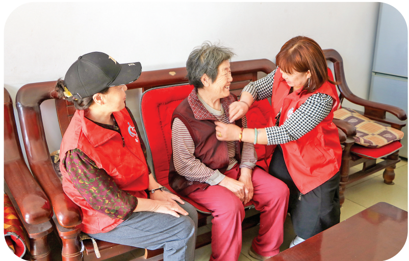
党员为孤寡老人开展志愿服务