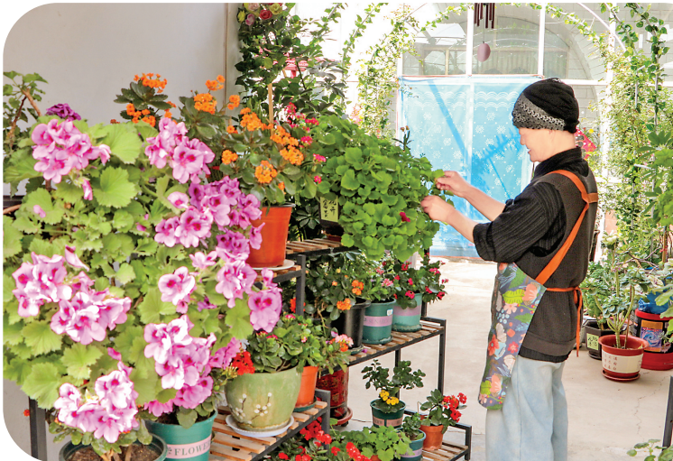
“星级文明户”打造“最美庭院”