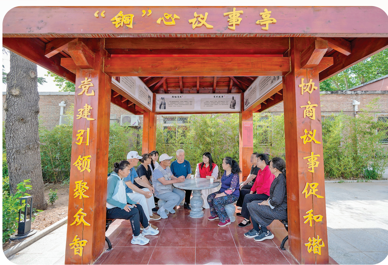
“铜”心议事亭聚众智促和谐

在社区治理的“微单元”里，“网格吹哨、部门报到”机制正在重塑服务流程。新城镇将114个网格细分为165个“微网格”，每个网格配备“党员中心户”，形成“社区大党委—小区党支部—楼栋党小组”三级响应体系。吉林社区网格员在走访中发现独居老人用餐难题，迅速联动民政部门推出“社区食堂+送餐上门”服务，日均服务120人次；古城社区通过“清听民声议事厅”收集32条停车难建议，协调机关企事业单位开放200个夜间停车位，让“停车难”变成“都好停”。这些“家门口的治理”，让群众切实感受到党组织就在身边。 在垣曲基层治理中，服务阵地的“亲民化”改造，正在重构党群关系的物理空间与心理距离。71个村级党群服务中心变身“幸福驿站”，每月15场“苗稼集市”提供健康义诊、爱心义剪等10类服务，累计服务2000余人次；8个“五有”示范小区里，红色书吧、亲子乐园、议事亭等功能空间一应俱全，居民自发成立“楼栋自管会”，自主解决电梯维修、绿化养护