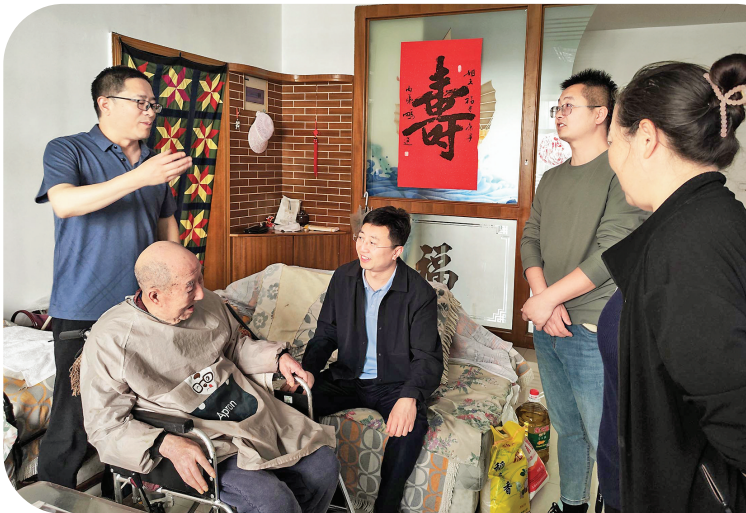
关爱高龄老人 共建幸福社区