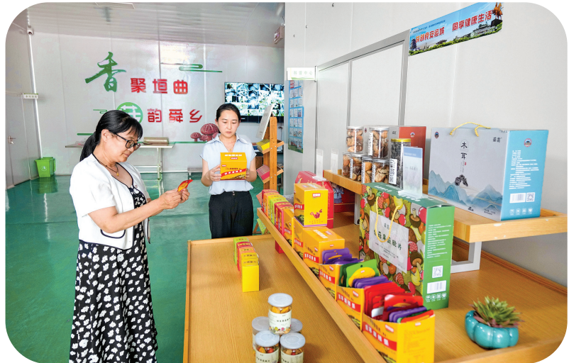
研发新产品延伸传统农业产业链

一季度全县地区生产总值和一般公共预算收入增速均排全市第一，成为全省唯一有两个抽水蓄能项目的县，是全省首个出口食用菌深加工产品的县，历山·左岸康养民宿、东寨码头、岭回桃花源成为新的网红打卡点……垣曲县各项工作呈现高质量发展新局面。