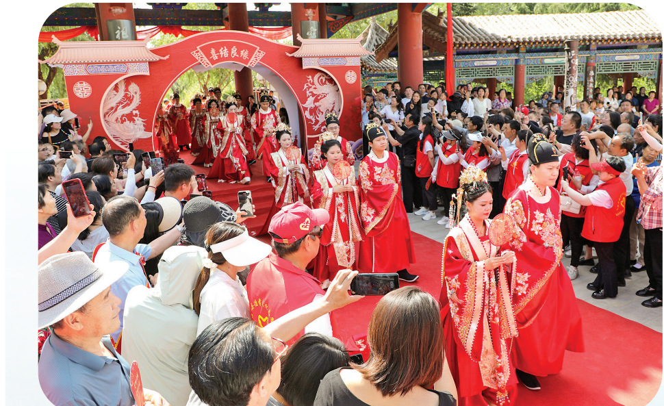
集体婚礼推动移风易俗倡导文明新风

基层治理的终极指向，是解决群众“急难愁盼”的具体问题。在基层治理中，垣曲县以“小切口”破题“大民生”，在社区网络的精微处、在服务阵地的亲民处、在制度创新的关键处，构筑起有温度、有质感的治理场域。