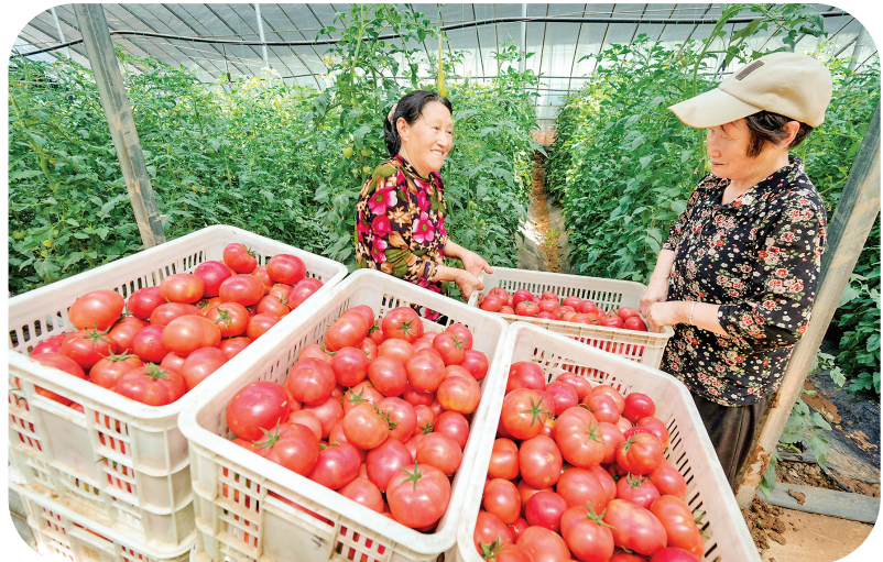
设施蔬菜种植喜获丰收