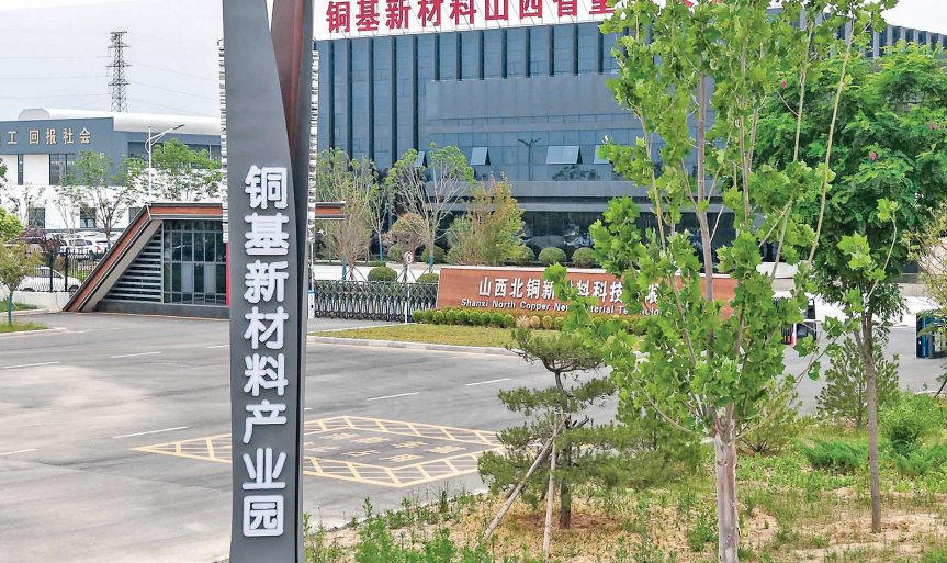
▲铜基新材料产业园