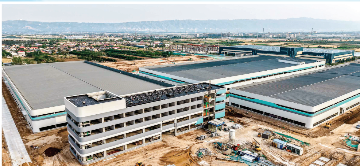
▲山楂树下(运城)果汁有限公司施工现场