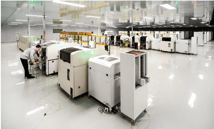
▲光影显示(运城)科技有限公司生产车间