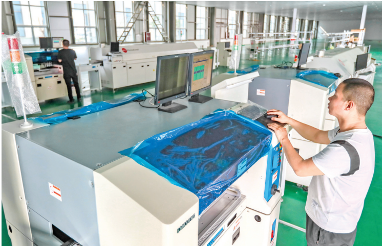
▲山西捷电科技有限公司生产车间