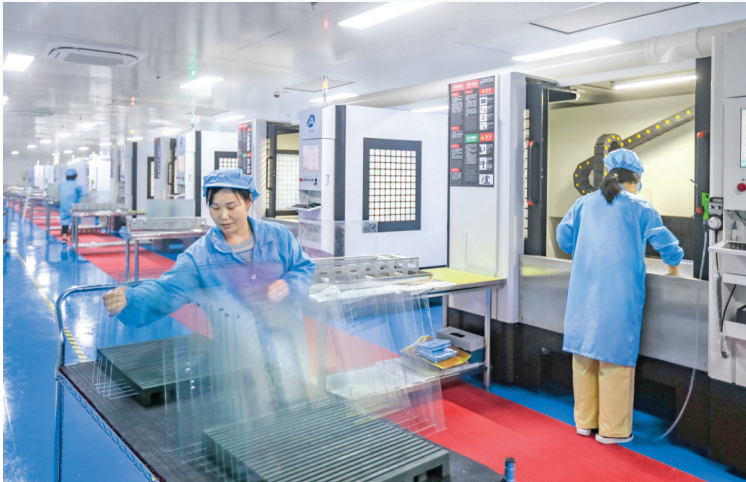
▲山西鸿运智控光电有限公司生产车间

本版策划 文字 韩维元 责任编辑 图片 金玉敏 校对 陈方斌 付炎 孙勇 李丹凤