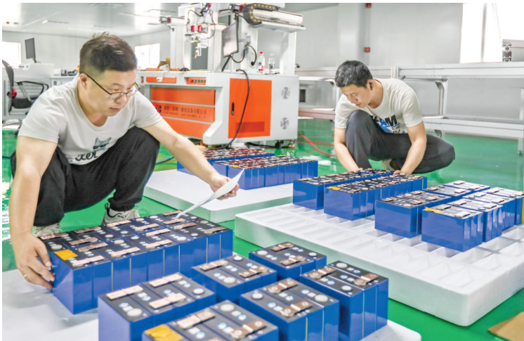
▲山西力事达科技有限公司生产车间