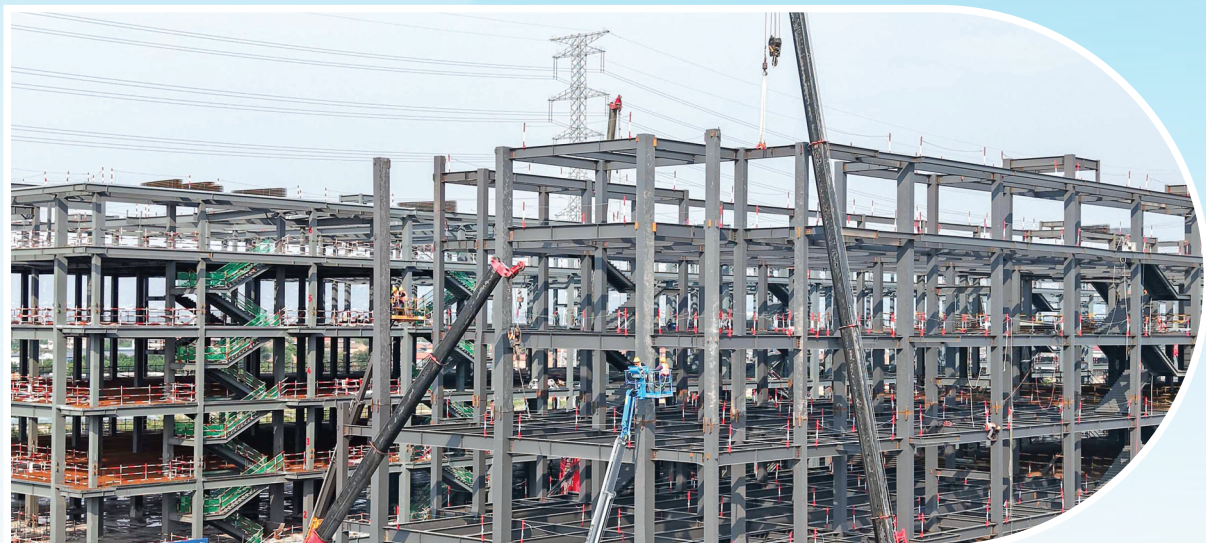
▲英飞拓5G智能终端产业基地