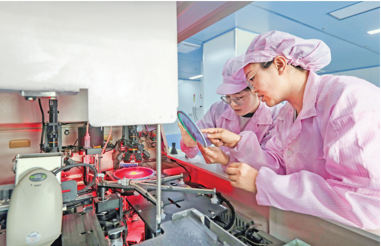
▲两步半导体(山西)有限公司生产车间