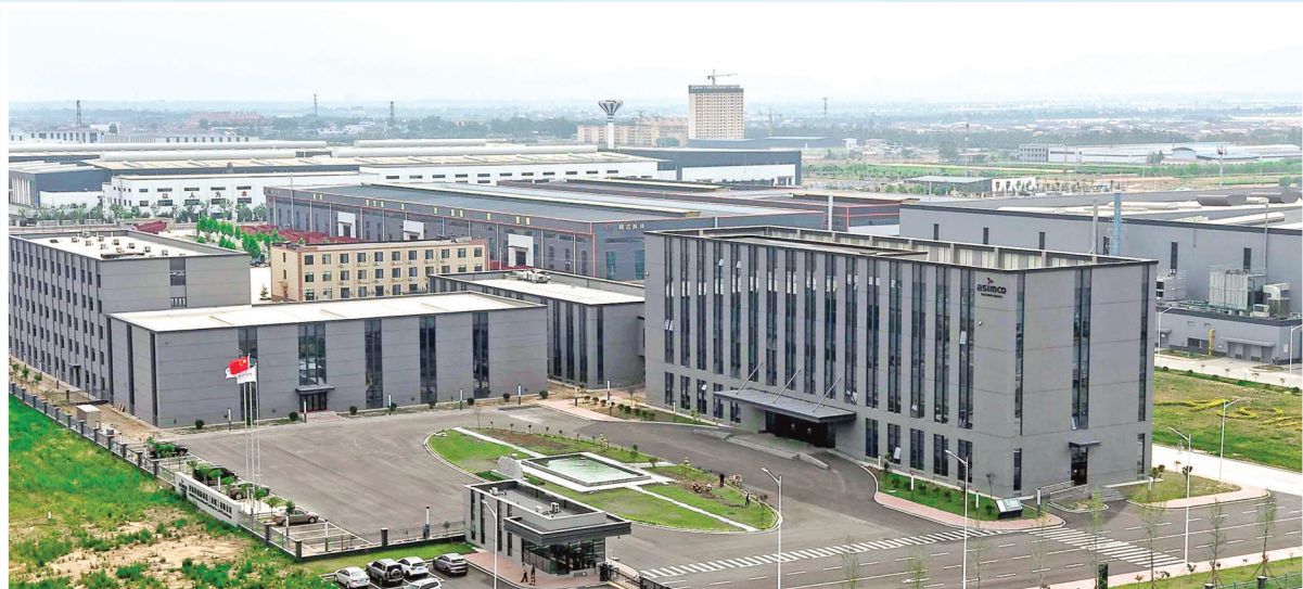
▲亚新科国际铸造(运城)有限公司