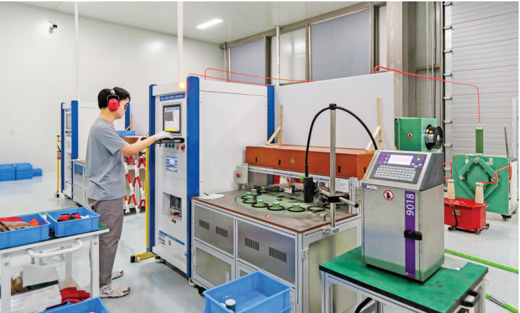
▲超瓷科技(山西)有限公司生产车间