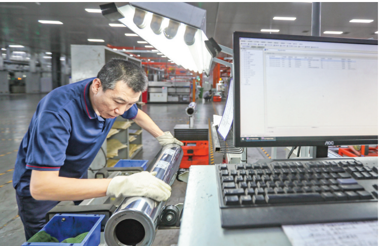
▲运城制版智能制造生产线