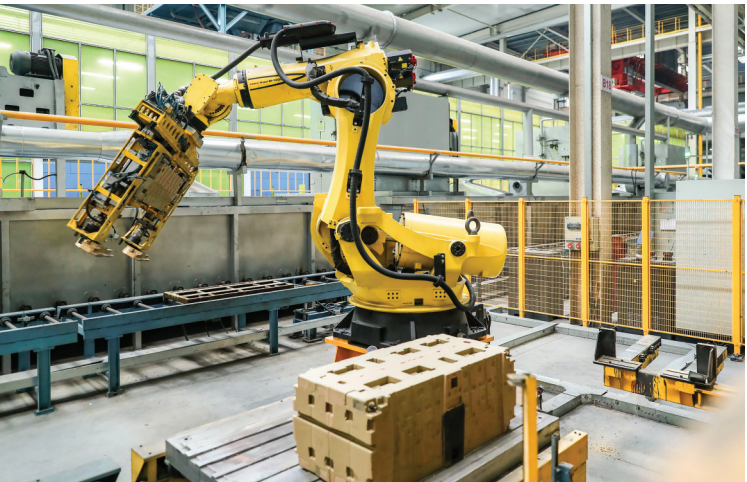
▲亚新科国际铸造(运城)有限公司智能生产线