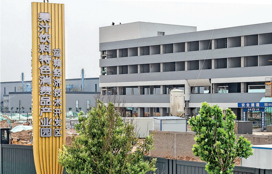
▲特色消费品产业园