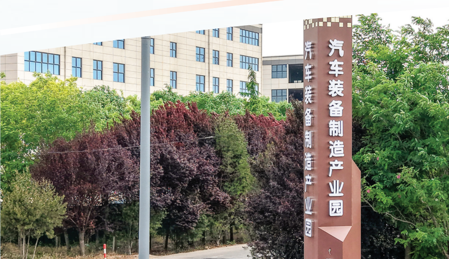
▲汽车装备制造产业园