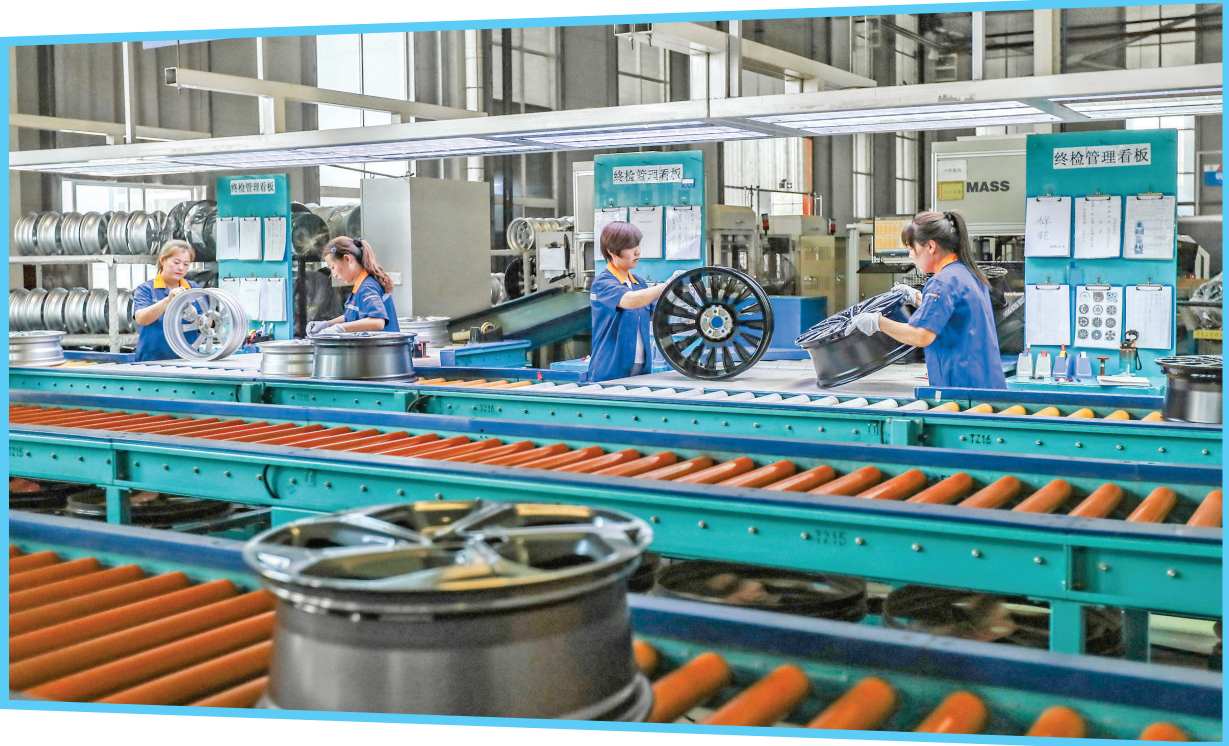
▲山西同晋金属材料科技有限公司生产线

作为制造业转型升级的核心驱动力，智能制造产业正成为运城经济技术开发区新生产力的主力。总投资8.7亿元的运城制版新建凹版印刷电子雕刻版辊及压纹版辊自动化智能制造生产线二期，其龙高端包装新材料