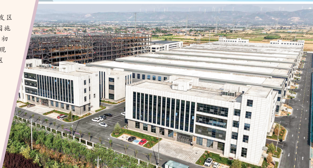
▲新城置业装备制造产业园

盐池之畔，倾听发展澎湃潮声；中条山下，演绎波澜壮阔新篇。 作为全市经济发展的主战场、主阵地、主引擎，运城经济技术开发区始终坚持以全面深化改革激发创新活力。在新城置业装备制造产业园施工现场，起重机的吊臂划破晨雾；山楂树下年产30万吨浓缩果汁项目初见雏形；不远处的铜基新材料产业园内，铜带、铜箔、覆铜板等实现全链条贯通……这片占地93.59平方公里的土地上，正上演着中部地区承接产业转移的生动实践。 去年以来，运城经济技术开发区聚焦“一城两区三门户”目标和思路，紧扣“合汽生材”新兴产业地标，全力实施“3633”战略：重点发展汽车装备制造、铜基新材料、电子信息三大产业，培育壮大汽车装备制造产业园、铜基新材料产业园、光电产业园、特色消费品产业园、智能制造产业园和数字经济产业园，倾力打造科技创新、对外开放和人力资源三大平台，全力锚定招商引资、项目建设、优化营商环境三大任务，全力培育新质生产力，争做建设富裕、文明、幸福好运之城的先行者，当好打造产业转移优先承接门户的主力军、打造内陆地区对外开放门户的示范区，争创国家级开发区。