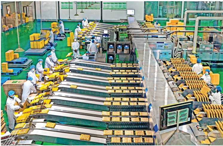
▲晋龙年存栏600万只蛋鸡养殖场建设项目