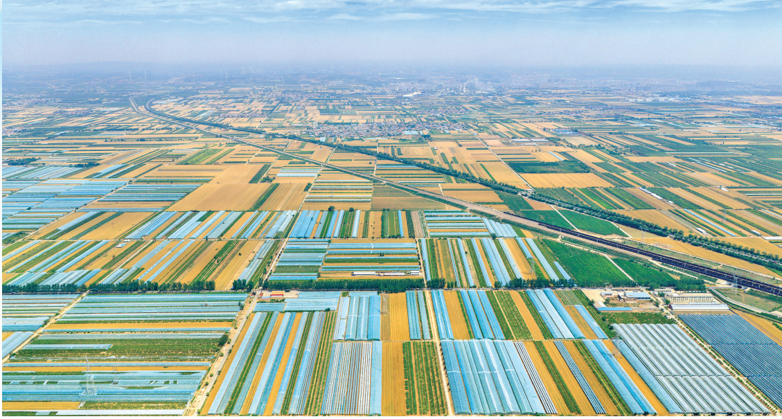
▲生态田园生机勃勃