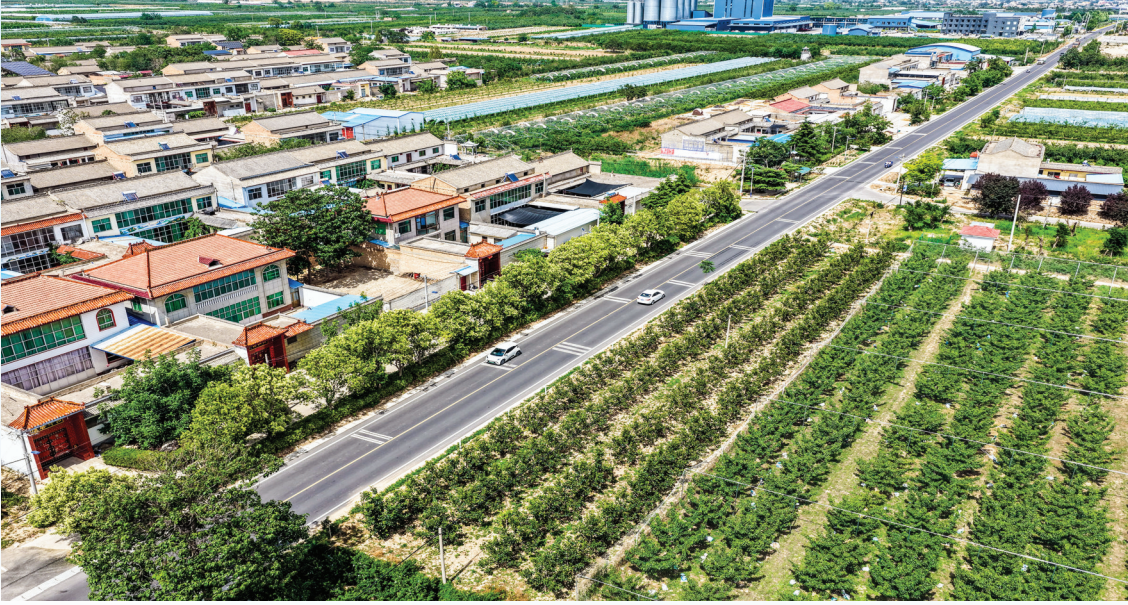
▲旅游公路带富乡村