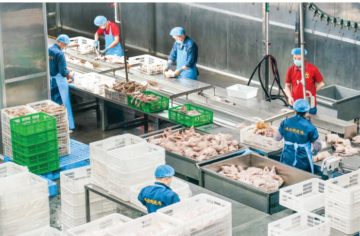
▲画宝刚年产1200万只烧鸡深加工项目