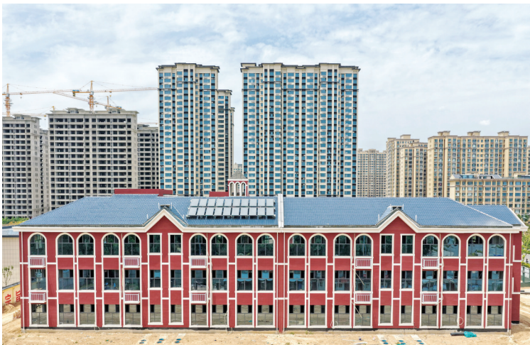
▲临猗县实验(第五)幼儿园建设项目