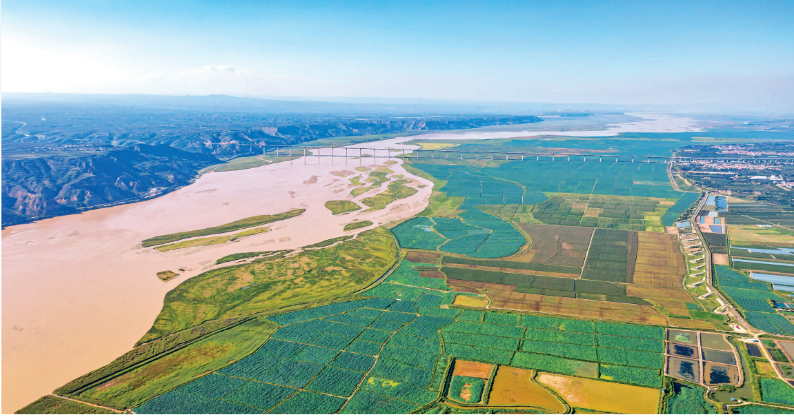
▲黄河滩涂秀美壮丽

黄河滩涂蟹肥稻香,万亩荷塘碧连天,乡村振兴活力扑面而来;智能化车间里,机械手臂精准作业,新兴产业蓬勃发展;“邠阳果园”千亩示范基地绿意盎然,轻简优质高效模式引领产业升级,累累硕果映衬现代化农业新图景…… 近年来,临猗县始终坚定扛牢黄河重大国家战略临猗担当,深入贯彻落实省委、省政府关于黄河流域生态保护和高质量发展工作部署,紧紧围绕市委创建黄河流域生态保护和高质量发展先行区的目标和任务,以生态筑基、产业赋能、文化铸魂,书写黄河流域生态保护和高质量发展的生动实践。