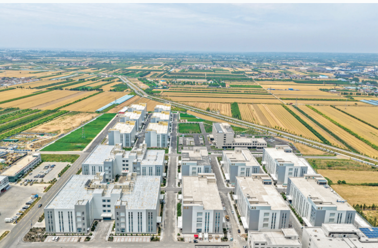
▲临猗县智能终端电子产业园