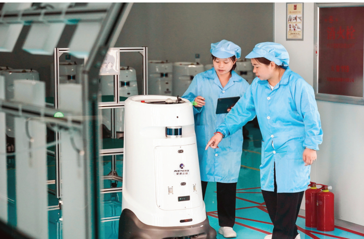
▲星辰云图年产功能型系列机器人8万台、智能传感器50万套建设项目