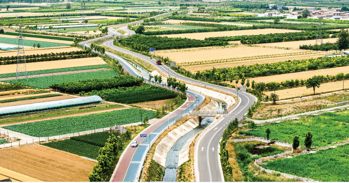
▲河道治理卓有成效