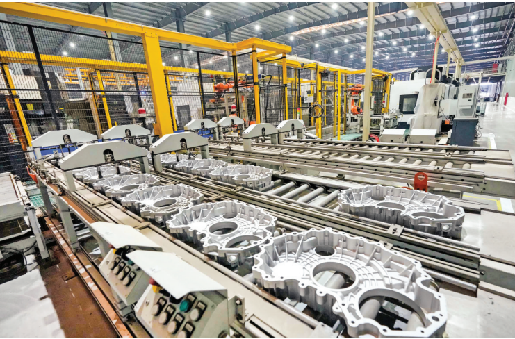
▲华恩实业年加工30万件汽车零部件生产线项目