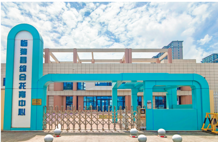
▲临猗县综合托育中心