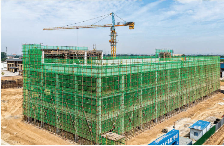
▲临猗农产品加工园标准化厂房及配套设施建设项目

本版策划 雷哲侠 文字 李丹凤 贵 编 付炎 校对 孙勇 李丹凤