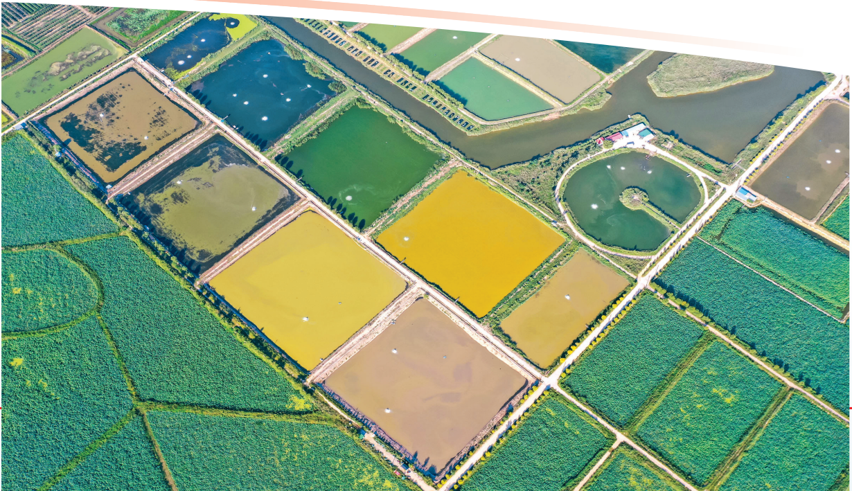
▲薛村村黄河大闸蟹养殖基地