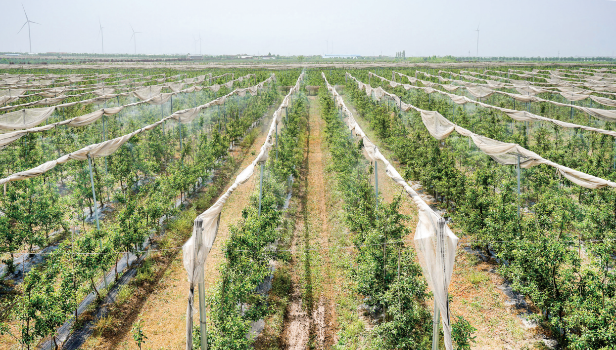
▲绿色轻简优质高效(苹果)千亩示范基地