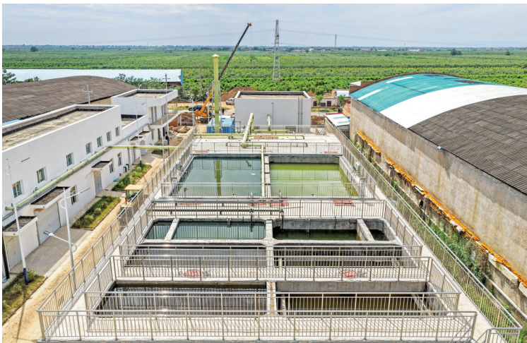
▲乡镇污水处理厂建设项目