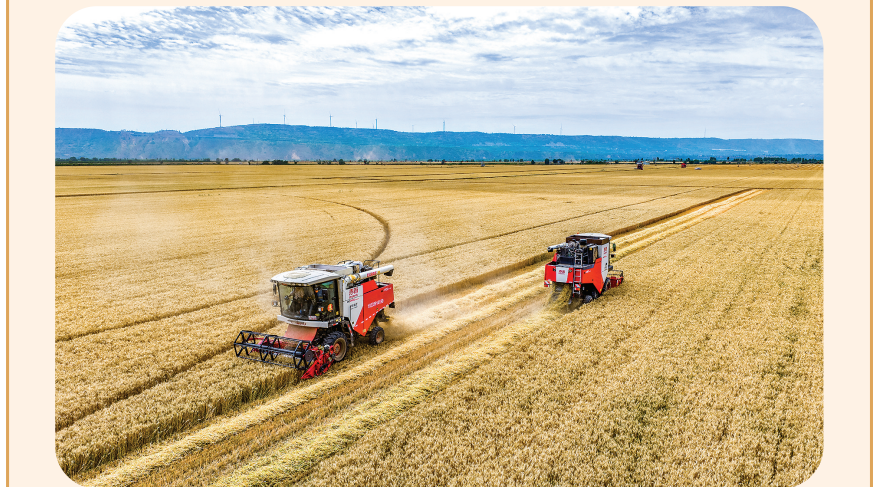
6月4日,收割机械在山西省芮城县东垆乡黄河滩涂远鹏智慧农场收割小麦。

产机械化技术指导意见,指导麦收省份组织农机现场会、专题培训班等实操实训,参与农机手和修理工达160多万人次。此外,还组织各地选派农机化技术骨干深入田间地头开展巡回指导,帮助调节机具参数,提醒控制作业速度,努力提高作业质量。 据气象部门预测,6月6日全国将迎来新一轮降雨过程,麦收地区大部将有小到中雨,部分地区将有中到大雨、局地暴雨。当前江苏、山东等麦收重点省份正在集中开展大规模抢收作业,农业农村部将高度关注天气变化,会同有关部门持续强化农机跨区通行、作业用油等服务保障,组织麦收省份精准调度机具,提前部署应急抢收作业,抓好作业现场和运输通行安全,确保“三夏”麦收平稳有序推进。