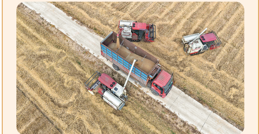
6月5日,在江苏省淮安市洪泽区黄集街道,农机手驾驶收割机将收割的小麦装车(无人机照片)。

(上接第一版)要精心做好考务服务和综合保障工作,统筹抓好交通引导、噪音管控、食品安全、医疗卫生等服务保障,强化心理疏导和人文关怀,全力以赴创造安全安静的考试环境。要严肃考风考纪,全力保障高考公平公正、平稳顺利。 据悉,今年“新高考”将采用“3+1+2”考试模式,“3”:语文、数学、外语(含听力,