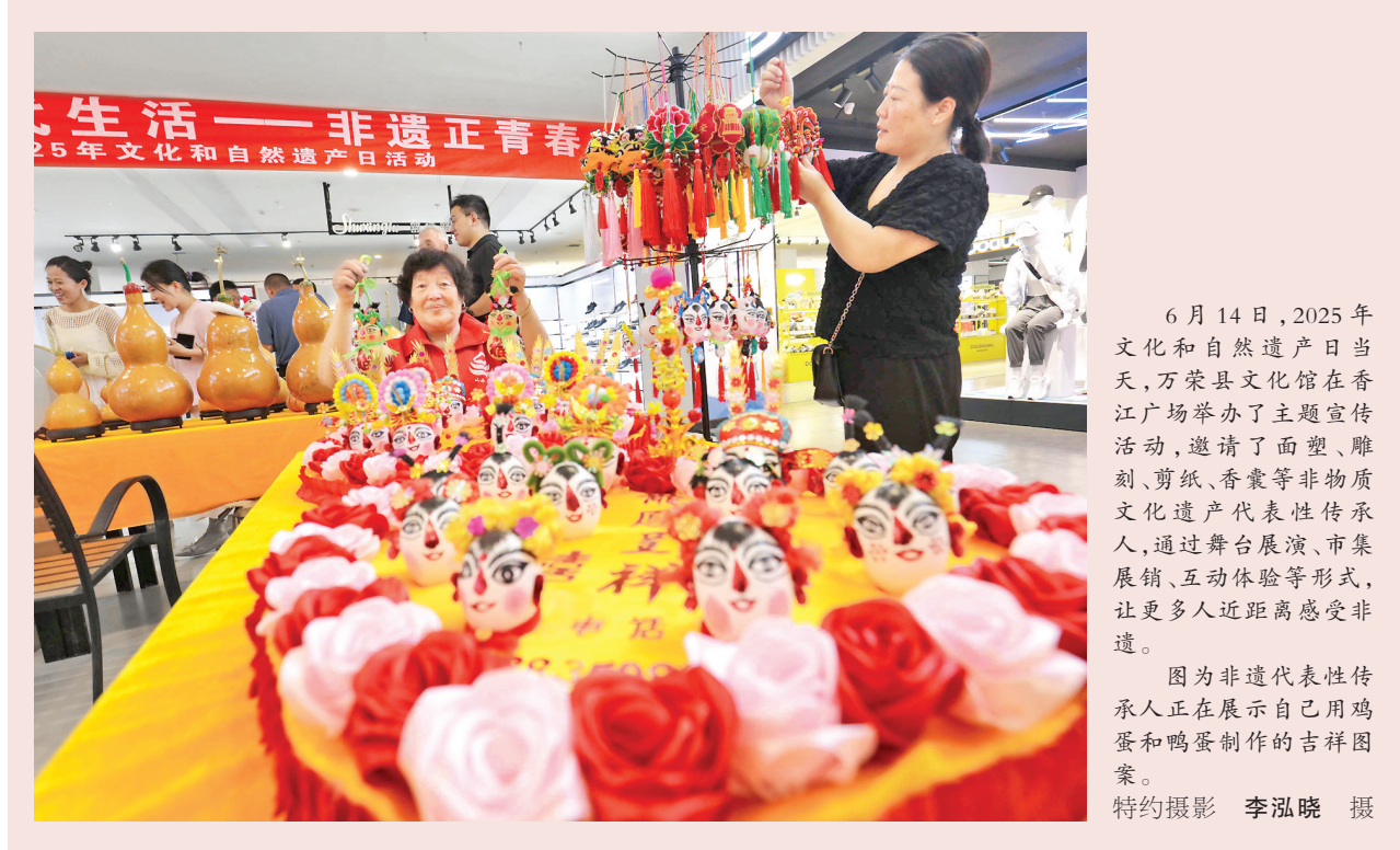
6月14日,2025年文化和自然遗产日当天,万荣县文化馆在香江广场举办了主题宣传活动,邀请了面塑、雕刻、剪纸、香囊等非物质文化遗产代表性传承人,通过舞台展演、市集展销、互动体验等形式,让更多人近距离感受非遗。

言漫谈》诙谐幽默,用方言土语展现了晋南地域特色;二胡重奏《新赛马》《敖包相会》,节奏欢快,呈现经典,完美展现了传统乐器的独特韵味;男声独唱《拉着妈妈的手》充满深情,与台下观众产生了共鸣;男子群舞《送你一朵小红花》充满阳刚之气,尽显青春风采;女声独唱《人说山西好风光》让大家再次领略山西民歌的魅力。