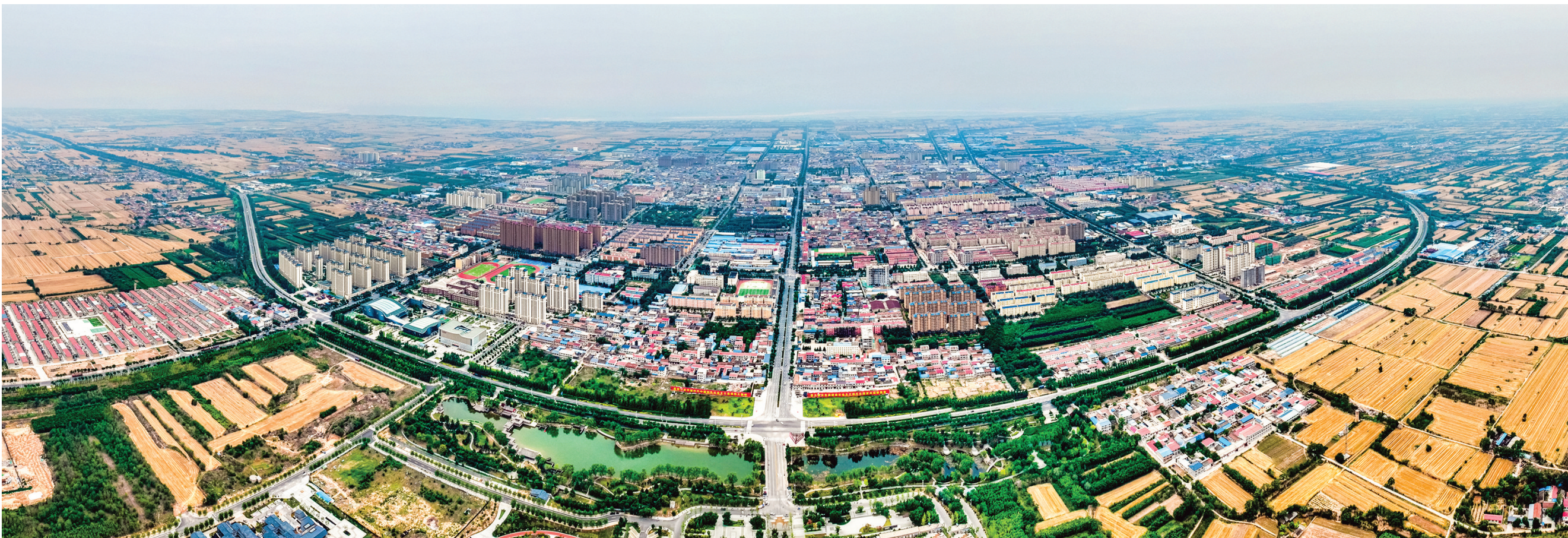
芮城县扎实有力推动“一城两区三门户”目标和思路,县委“1544”工作矩阵落实落地,实现基层治理体系全面重塑、治理能力整体跃升。图为芮城县航拍图。

元跃升至300万元;永乐镇蔡村创新“五股联动”——土地入股企业、保底入股合作社、集股办加工厂、分股招商铺、重股再投资,年集体经济收入超316万元。 村级末梢“深扎根”。在最小治理单元,党建优势转化为服务效能。东天村搭建数字乡村平台,AI监控实现独居老人异常行为预警;兴耀村建立“党建+法治+网格”模式,网格员化身“移动宣传员”,线上推送政策,线下入户调解;美团外卖党支部设立“骑士之家”,引导骑手认领民情收集员、食品监督员等七大岗位,成为流动的“治理探头”。“以前送餐来去匆匆,现在我们是社区治理的“眼睛”和“耳朵”。”骑手党员张师傅说。