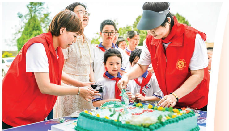
▲芮城县聚焦民生需求,打造“党建+志愿服务”品牌,引导志愿者在基层治理中积极发挥作用。图为芮城县爱心公益志愿者协会志愿者为阳祖小学学生过儿童节。

本版策划 雷哲侠 本版文字 李丹凤 本版责编 付炎 校对 孙勇 李丹凤