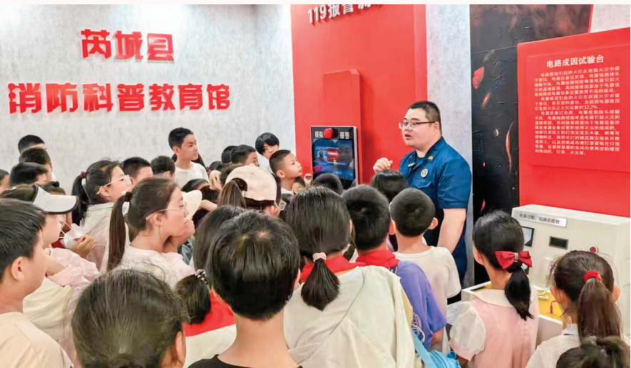
▲“六一”儿童节前,芮城县民政局邀请40余名留守儿童到芮城县消防科普教育馆开展夏研研学活动。