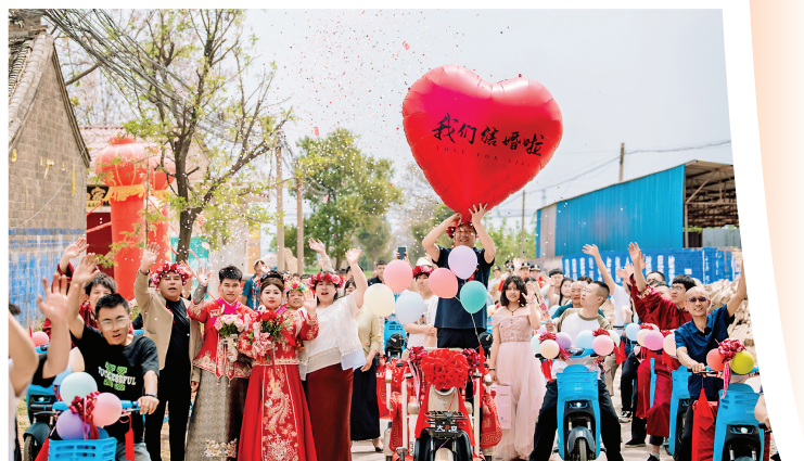
▲芮城县深入推进移风易俗工作,教育引导人民群众自觉践行文明婚嫁新风尚。图为学张乡新人骑电动“小喜车”迎亲,节俭环保婚礼获群众点赞。