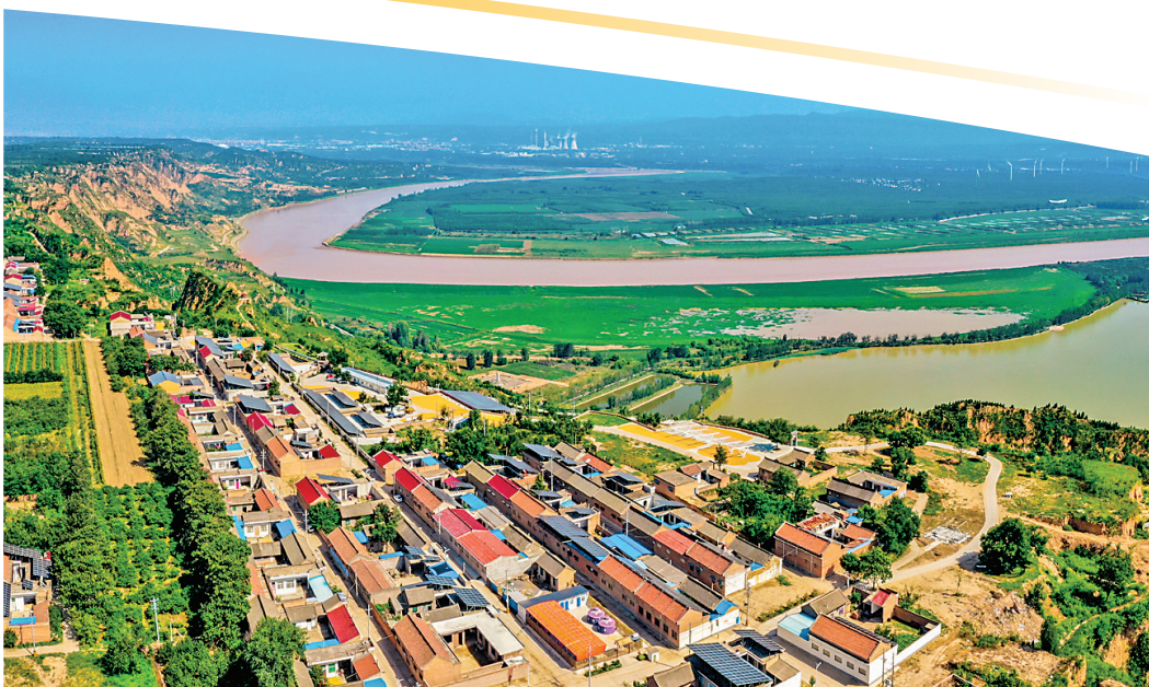
▲芮城县陌南镇庄上村积极探索绿色能源转型,走出一条“零碳”发展的创新之路,成为全国乃至全球瞩目的“中国零碳镇示范村”。图为庄上村航拍图。