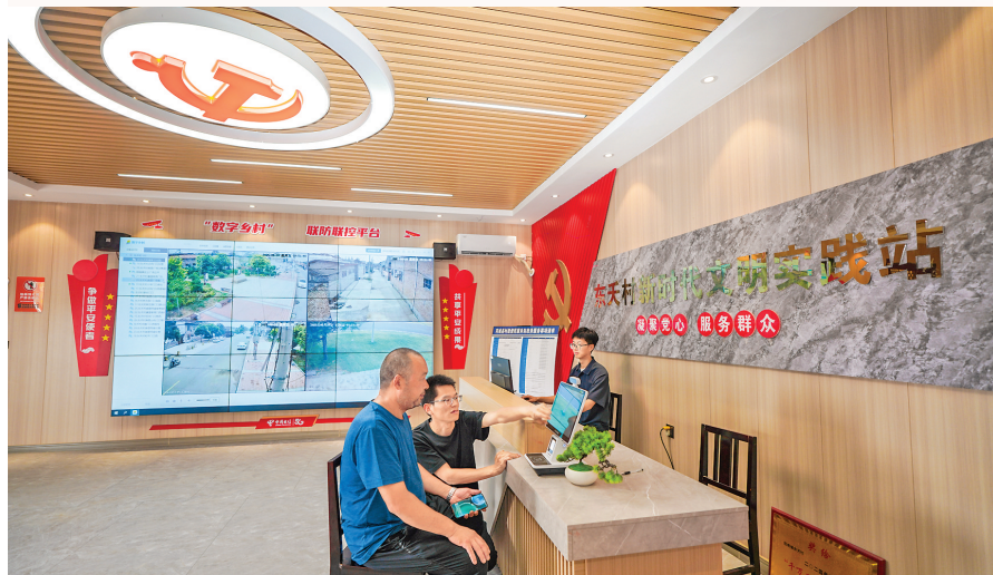
▲西南镇东天村党群服务中心内,联防联控平台的智慧大屏实时运行。图为东天村村干部帮助村民进行人脸识别。