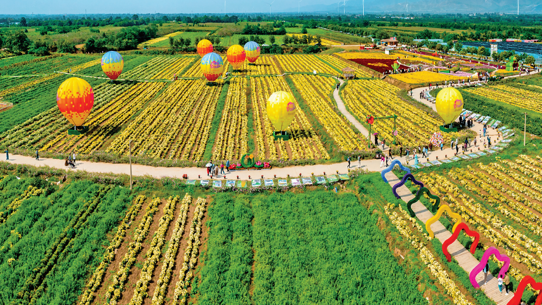
▲学张乡斜口村打造菊花小镇,发展菊花产业,推动农旅融合发展,从而带动集体经济。图为斜口村菊花小镇全景。