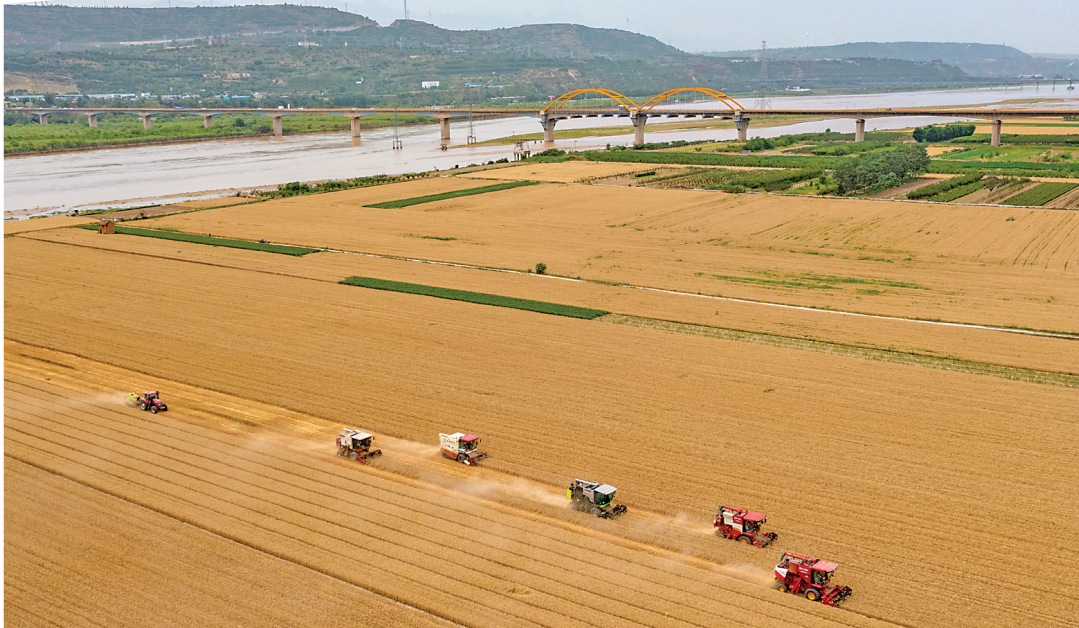
▲芮城县是产粮大县,今年小麦种植面积达到49.7万亩。夏收时节,当地党委、政府积极做好农收调度、技术服务等工作,确保夏粮颗粒归仓。图为收割机收割小麦的场景。