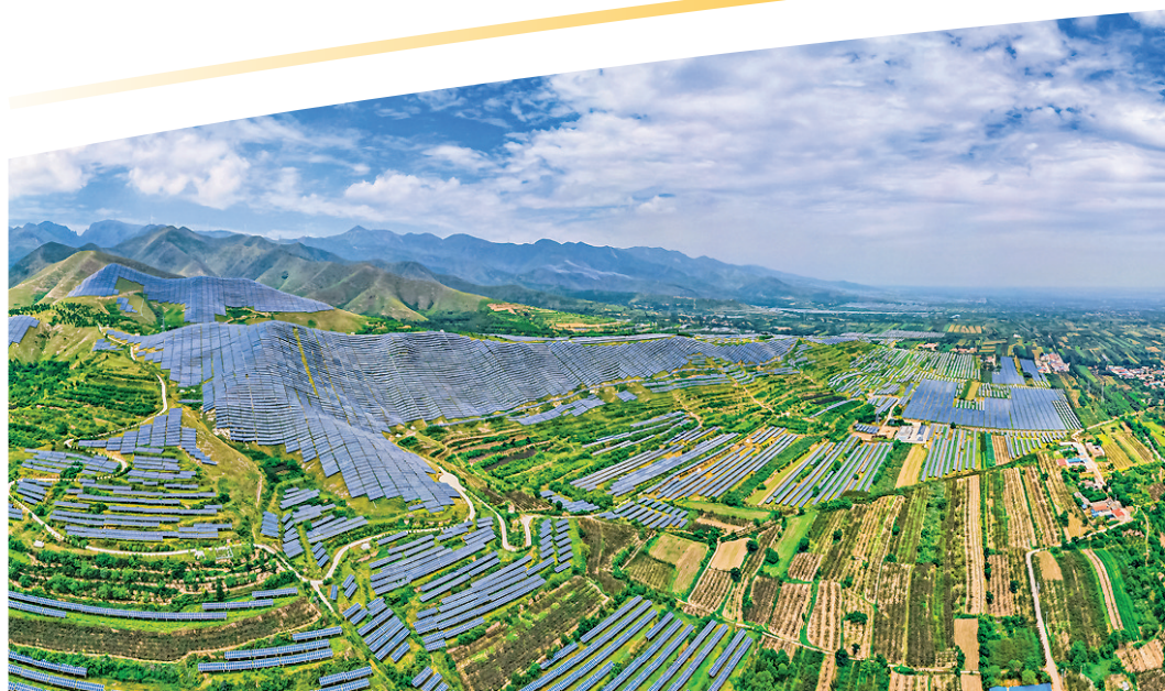
▲芮城县近年来积极探索光伏产业发展新模式,将荒山荒坡变为“金山银山”。图为光伏领跑技术基地与蓝天白云相互映衬,构成一幅绿色能源新画卷。