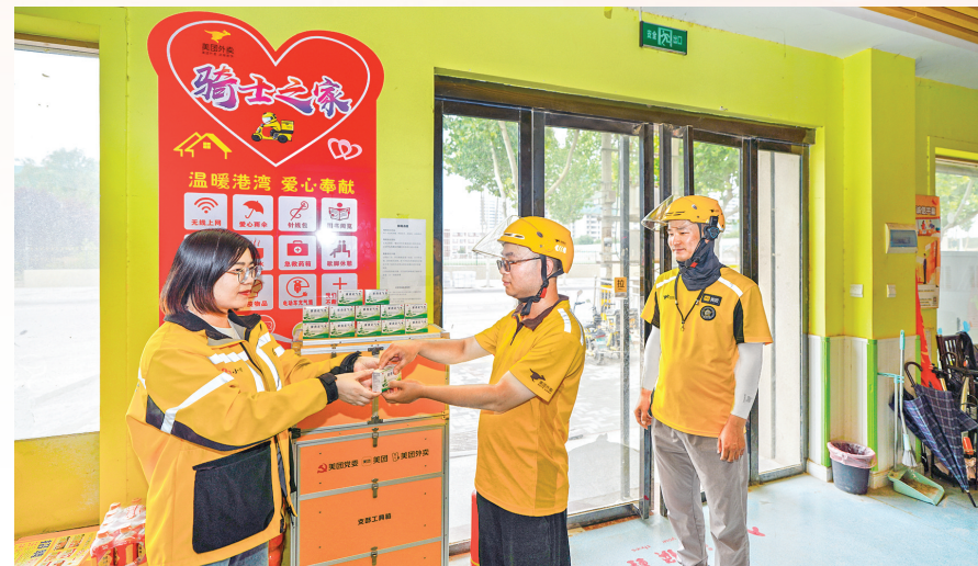
▲芮城县以“党建+”为破题之匙,不断增强党在新兴领域的号召力、凝聚力、影响力。图为近日美团外卖党支部为美团骑手发放霍香正气水。