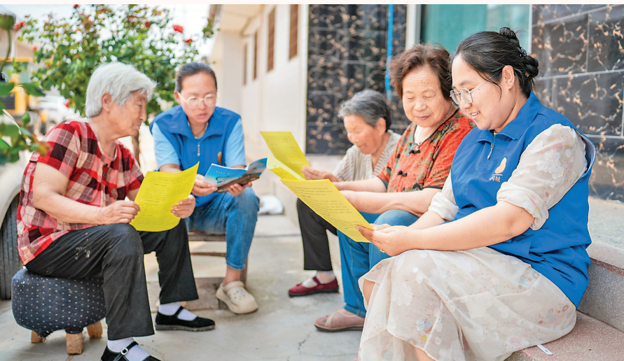
▲开展政策宣传是基层网格员服务群众的一项重要职责。图为南埕镇东张联村的网格员给村民讲解医保政策。