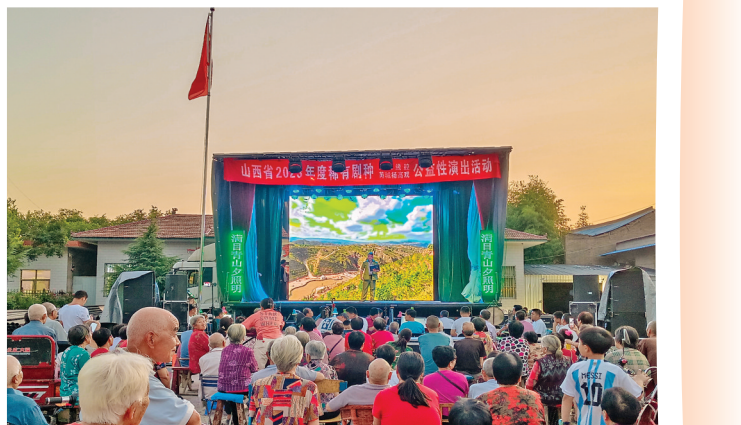
▲在基层治理中融入中华优秀传统文化,有助于涵养家风、村风社风。图为阳城镇组织村里老人观看稀有戏种公益性演出。