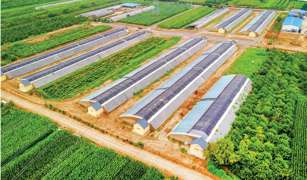
▲大王镇打破行政区划限制,集中各村力量打造香椿产业“飞入地”。图为大王镇村级集体经济联合发展产业园区。