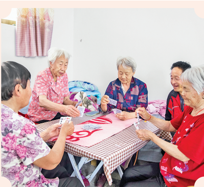
▲连日来,入住夏县尉郭乡阴庄村日间照料中心的20位老人,吃着可口的饭菜、享受着凉爽的空调,白天看书、打扑克,晚上围坐在一起观看影视剧,其乐融融。