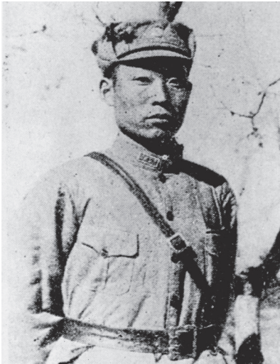
赵登禹像（资料照片）。