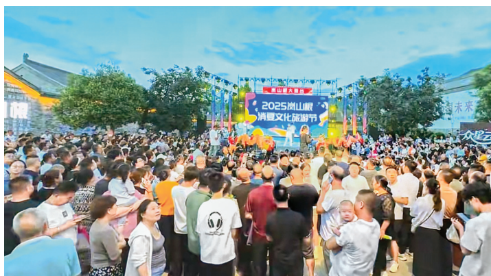
2025岚山根消夏文化旅游节现场,游客熙熙攘攘十分热闹。(资料图片)

7月5日傍晚,中条山下,盐湖之畔,岚山根·运城印象景区灯火次第亮起。暮色渐浓,岚山根的热度却直线飙升。景区路上车水马龙,游人如织,在这里畅享夏日美好时光。