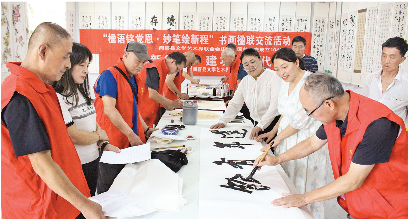
7月2日,闻喜县文联在闻喜县东镇镇官庄村,举办“悟语铭党恩 妙笔绘新程”书画楹联交流活动。活动现场,闻喜县书法协会、县

诗联学会和县美术家协会的部分会员,以歌颂党的伟大征程、描绘新时代美好生活为主题,挥毫泼墨,用丹青妙笔描绘祖国的壮丽山河和社会的