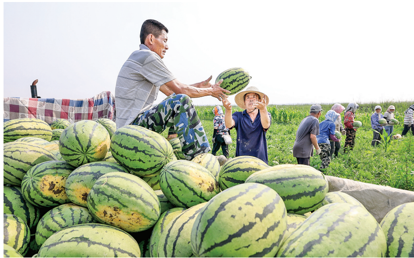
7月9日,河北省唐山市丰南区的农民在田间收获西瓜。近年来,丰南区引导各村因地制宜发展特色果蔬种植产业,促进农民增收。

“经过‘十四五’这五年,我们的制度优势更加巩固、创新活力更加强劲、物质基础更加雄厚、发展基础更加坚实,‘十四五’必将在中国发展史上留下浓墨重彩的一笔。”郑栅洁说,“展望未来,我们也充满信心,‘十五五’发展前景将更加光明。”