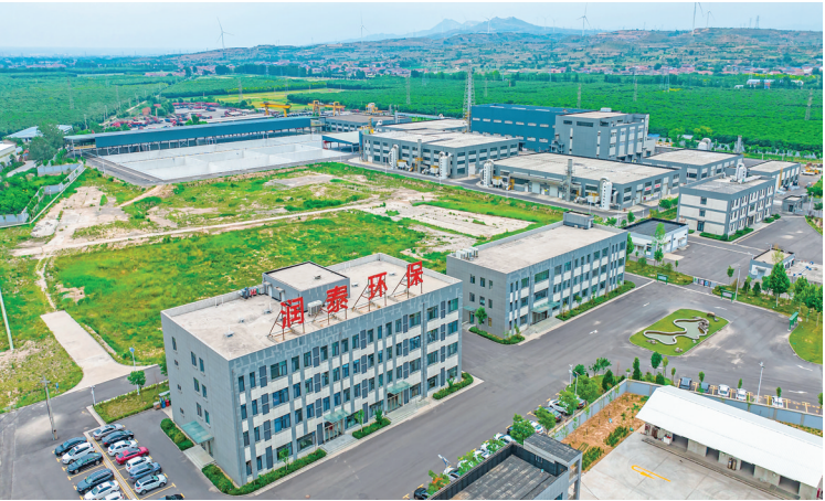
▲再生资源综合利用产业集群——润泰环保科技有限公司