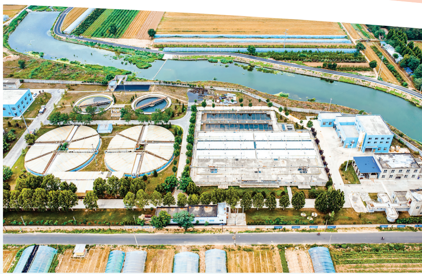
▲闻喜县惠万源污水处理有限公司