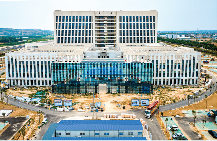
▲闻喜县人民医院建设项目