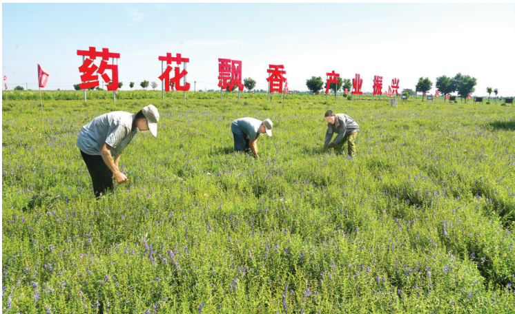
▲中药材生产加工产业集群——薛店镇中药材种植基地