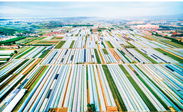
▲优质粮菜产业集群——邢村设施蔬菜大棚