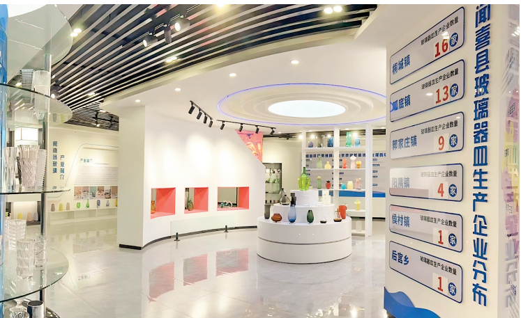
▲高档玻璃器皿制造产业集群——展示体验馆