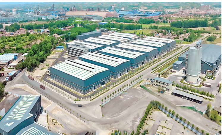
▲新兴装备制造产业集群——开发区标准化厂房