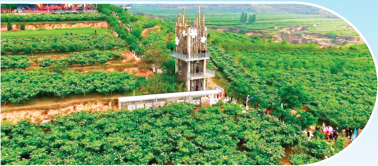
▲农文旅融合产业集群——山植种植基地