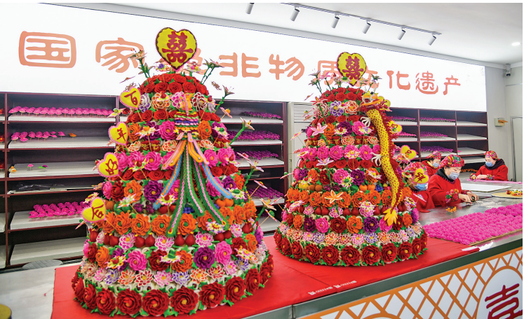
▲农副产品精深加工产业集群——闻喜花馍展厅