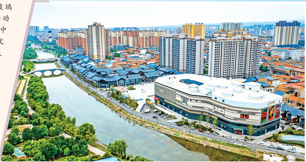
▲现代服务产业集群——涑水小镇

通过“双链双镇四基地”工作抓手，推动钢铁、金属镁、玻璃器皿等传统产业链延级，培育再生资源、数字经济等新兴动能，构建“11512”产业发展体系；依托陈家庄红色教育基地、中华宰相村、“喜”文化等独特资源，深化文旅融合，打造特色文旅品牌；以“千万工程”为牵引，统筹城乡基础设施与公共服务项目建设，推进新型城镇化与乡村振兴双向发力；聚焦生态保护，实施涑水河流域治理、矿山修复等工程，筑牢绿色发展基底。 闻喜县深入贯彻落实中央及省、市决策部署，围绕“一城两区三门户”目标和思路，以创建“黄河流域生态保护和高质量发展先行区”为引领，锚定“宜居宜业宜游地，幸福美好闻喜城”奋斗目标，以改革创新为动力，以产业升级为根基，以民生福祉为核心，为县域经济社会发展注入强劲动能，为高质量发展提供了可借鉴的县域样本。