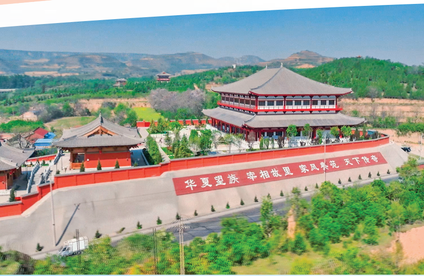
▲中华裴氏家风家教馆