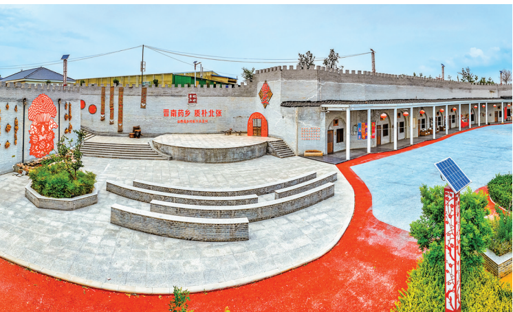
▲康养产业集群——北张民俗文化馆