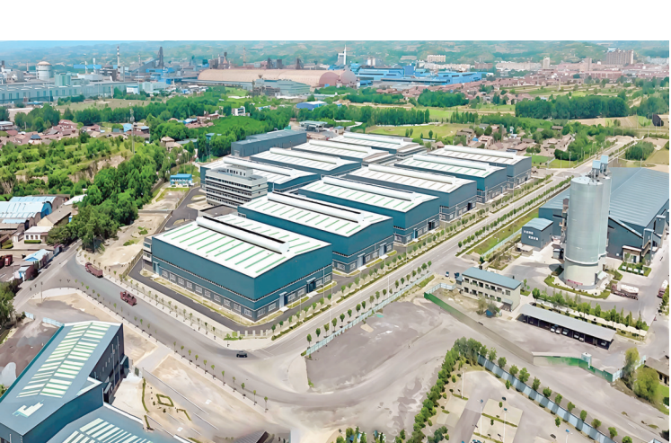
▲新兴装备制造产业集群——开发区标准化厂房