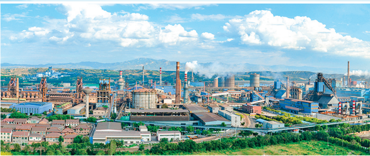
▲钢铁产业集群——山西建龙集团