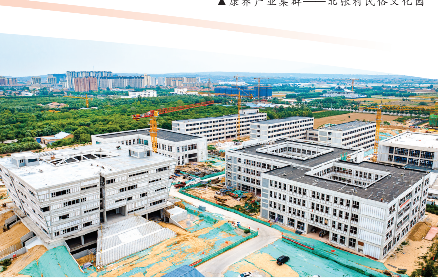
▲闻喜县职业教育提档升级新建项目