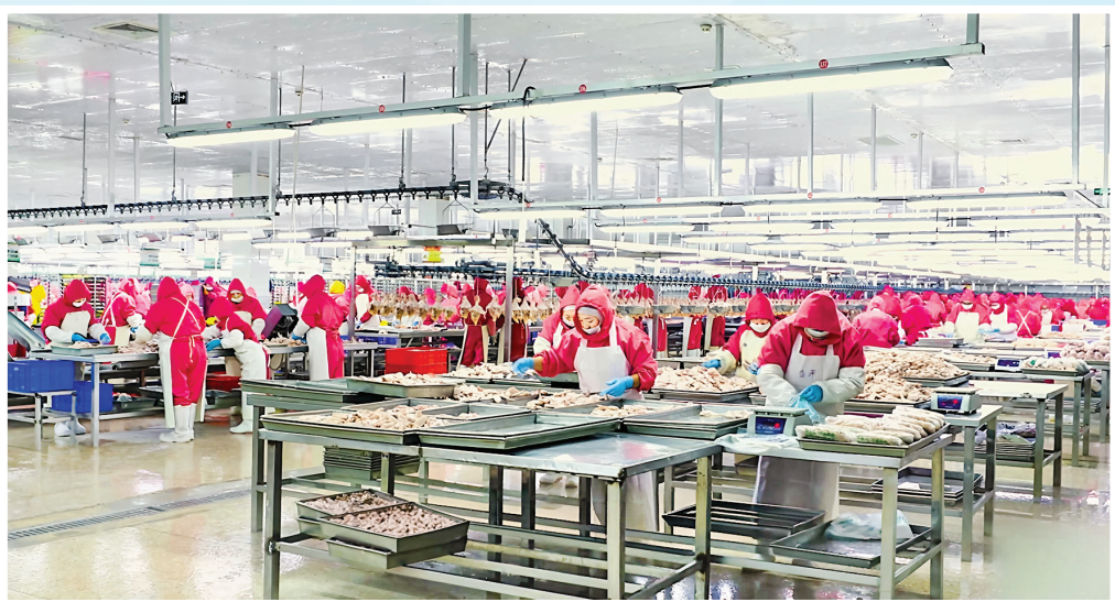
▲绿色农畜产品产业集群——象丰农牧科技有限公司