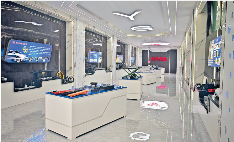
▲新材料产业集群——银光镁业集团产品展厅