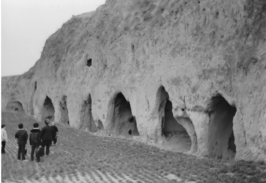
▲王彦萍烈士牺牲地

首战告捷后，王彦萍将抗日火种播向中条山。他在芮城一带建立抗日根据地，创建并领导条南抗日游击队。在党的领导下，他发动群众，壮大武装，坚持敌后抗战八年。游击队神出鬼没，断交通、炸仓库、袭据点、攻炮楼，与西北军及其他游击队密切配合，令日军寝食难安。《中国国防报》刊文指出：“王彦萍率部和十几支游击队配合作战。这些血性男儿，在强敌入侵、民族危亡的紧急关头，挺身而出，冲锋陷阵，血战拼杀，阻止了日寇西进南下的步伐。”为扑灭这支顽强力量，日伪军展开多次残酷扫荡，游击队损失惨重，王彦萍也曾被捕入狱。在狱中，面对酷刑利诱，他宁折不弯，被打断左臂，却仍以诗句“宁可血洒中华地，不做走狗遭人欺”自励。后经组织营救，他出狱后重返战场。