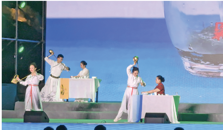
第三届夏县泗交消夏文化旅游节《晋茶之韵》表演现场。

茶韵沁凉处，生活自悠然。从茶园新抽的嫩芽到舞台上流动的茶汤，从茶博会上的创新茶食到两岸茶席的默契共鸣，夏县的茶故事越讲越宽。这杯茶里，藏着南茶北移的坚守奇迹，盛着两岸以茶会友的脉脉温情，更裹着普通人夏日里对“慢下来”的朴素向往。