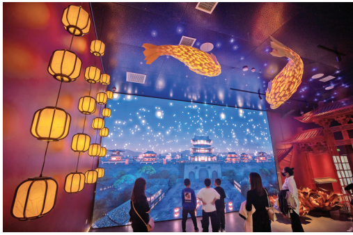
▲游客在河东历史文化展示中心沉浸式体验