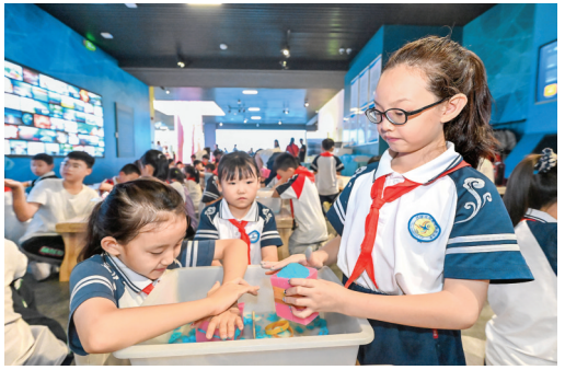
▲小学生在池盐博物馆体验盐雕DIY