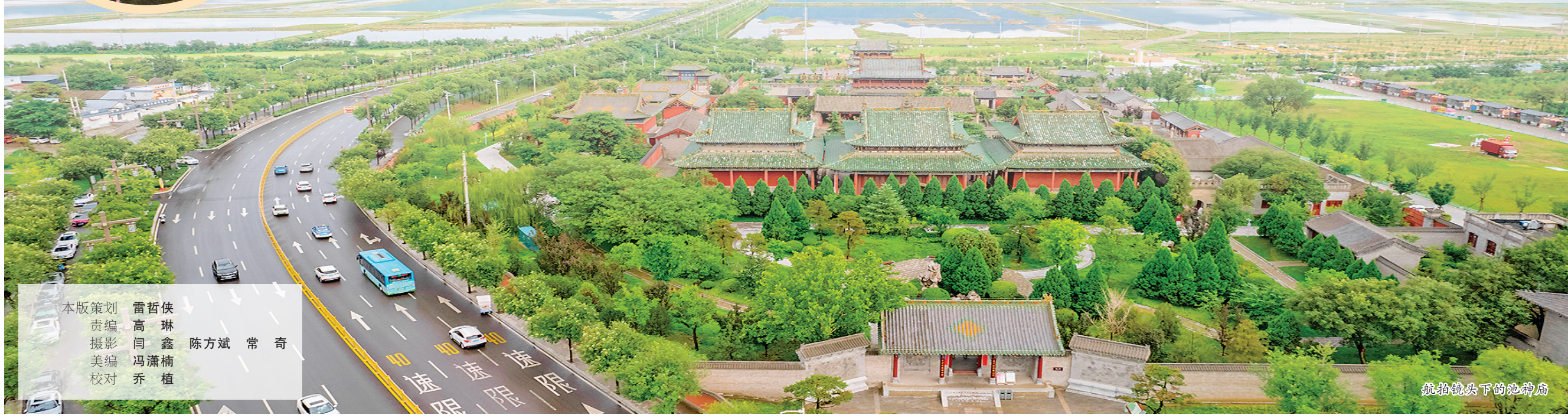
航拍镜头下的池神庙

本版策划 雷哲侠 责编 高琳 美编 冯潇楠 校对 乔植