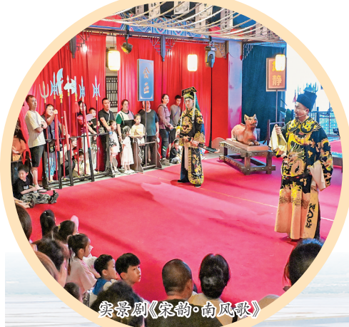
实景剧《宋韵·南风歌》