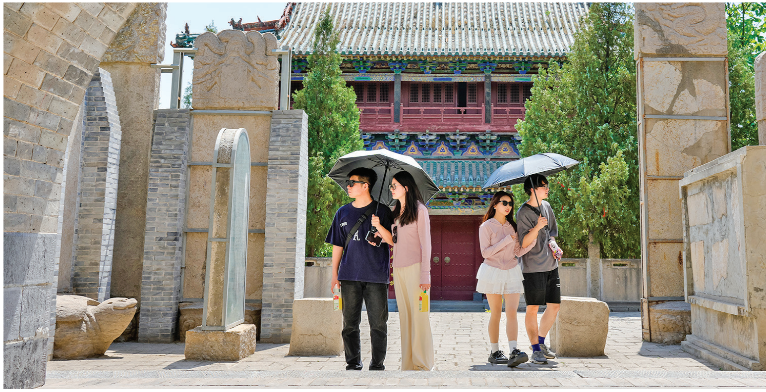
游客在池神庙参观游览

盛夏的盐湖波光潋滟，中条山苍翠如屏。在运城这片山水交融的土地上，千年盐运记忆正悄然重塑城市肌理：清代盐务衙门“河东盐池掣置署”的百年月洞门重现光彩；在河东成盐典故园，生动传神的雕塑刻画出盐运之城的千年历史；盐湖北坡的“盐梦长廊”将工业遗址变为文化地标……一幅生态与人文共生的崭新画卷正在徐徐展开。