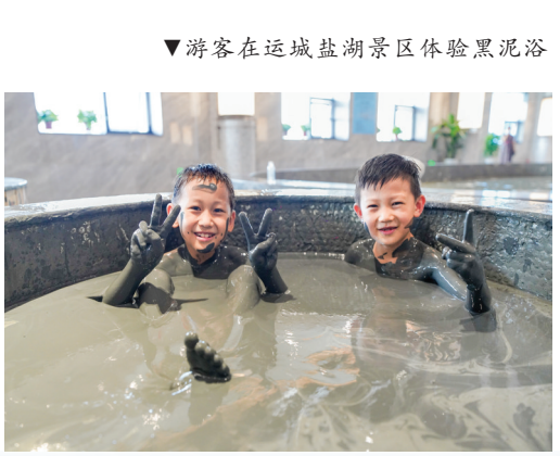
▼游客在运城盐湖景区体验黑泥浴