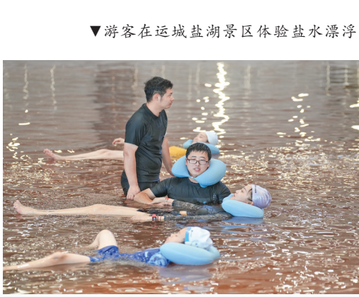
▼游客在运城盐湖景区体验盐水漂浮