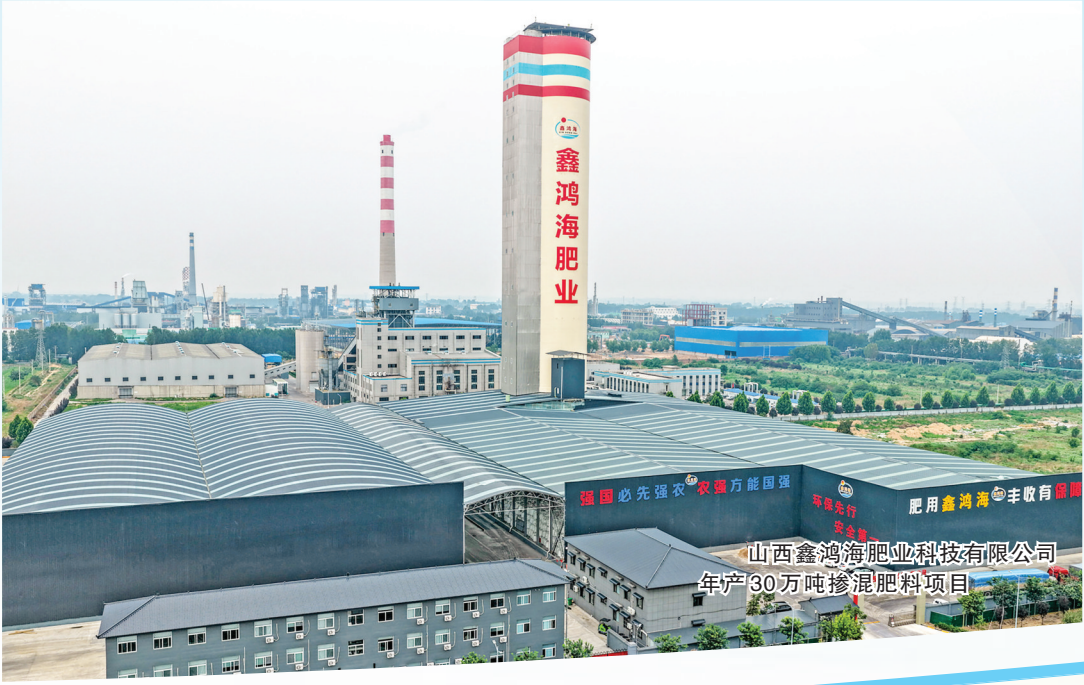
山西鑫鸿海肥业科技有限公司年产30万吨掺混肥料项目