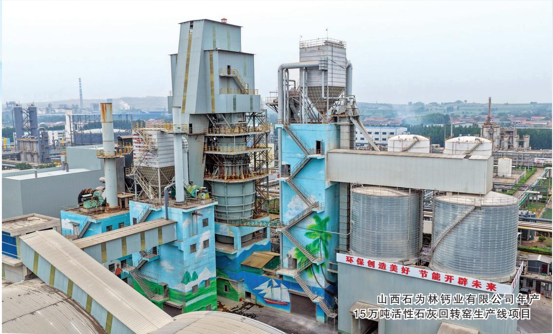
山西石汾林铁业有限公司年产15万吨活性石灰回转窑生产线项目