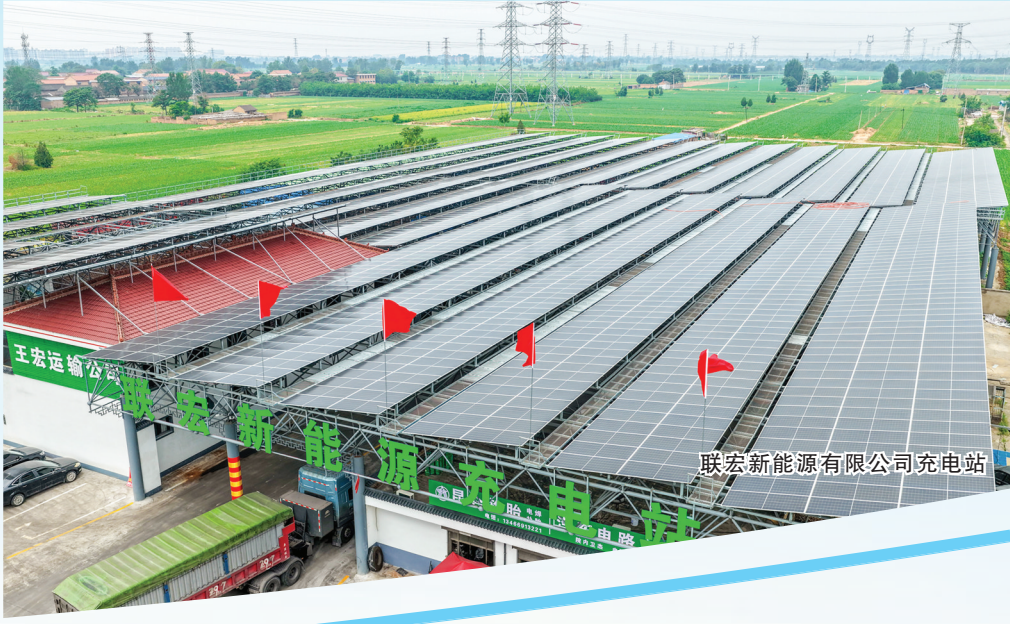
联宏新能源有限公司充电站