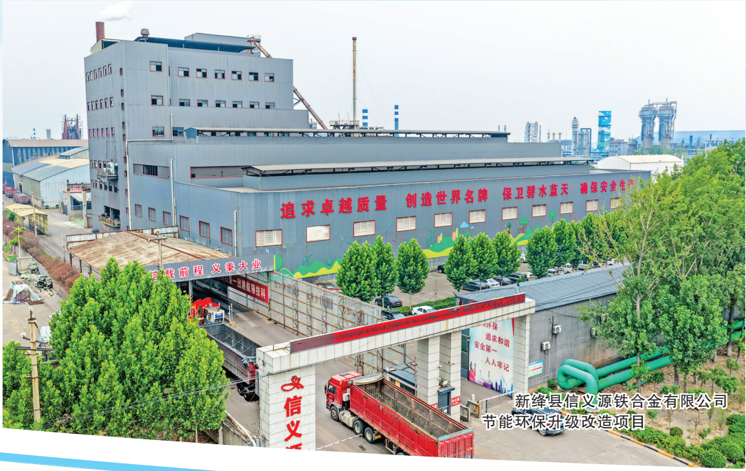
新绛县信义源铁合金有限公司节能环保升级改造项目