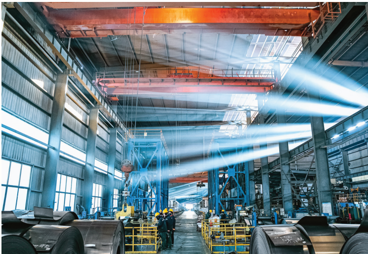
新绛天和金属制品有限公司年产132万吨精品镀锌带钢项目