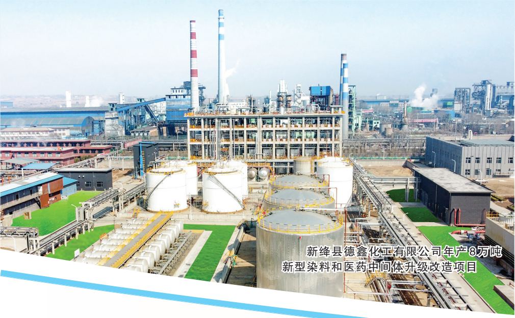
新绛县锦鑫化工有限公司年产8万吨新型染料和医药中间体升级改造项目