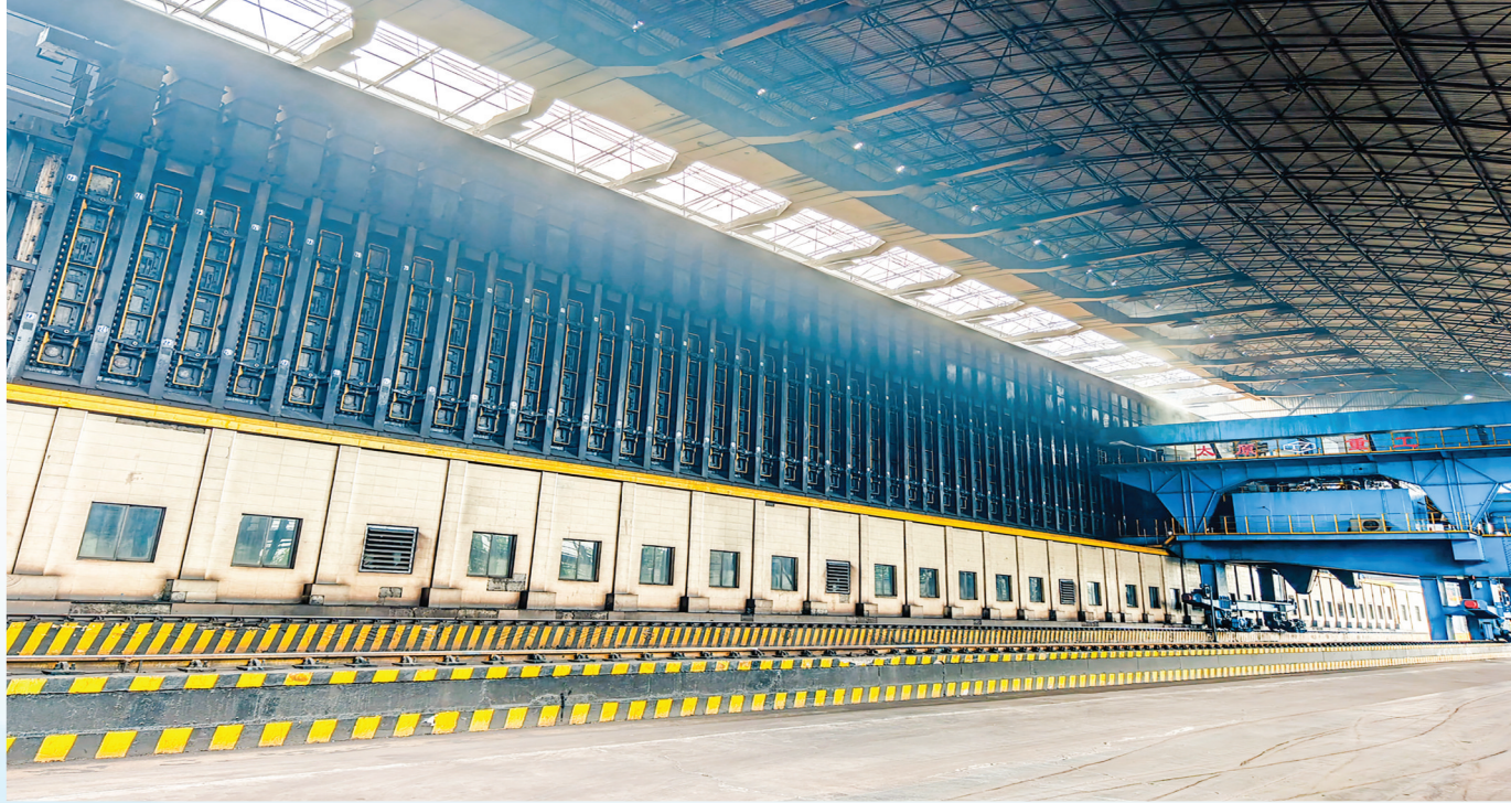
山西至信宝能科技有限公司年产150万吨美化空高度6.25米揭筒焦化项目