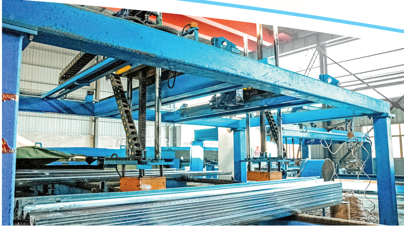
山西中通交通设施有限公司年产50万吨公路护栏设施项目