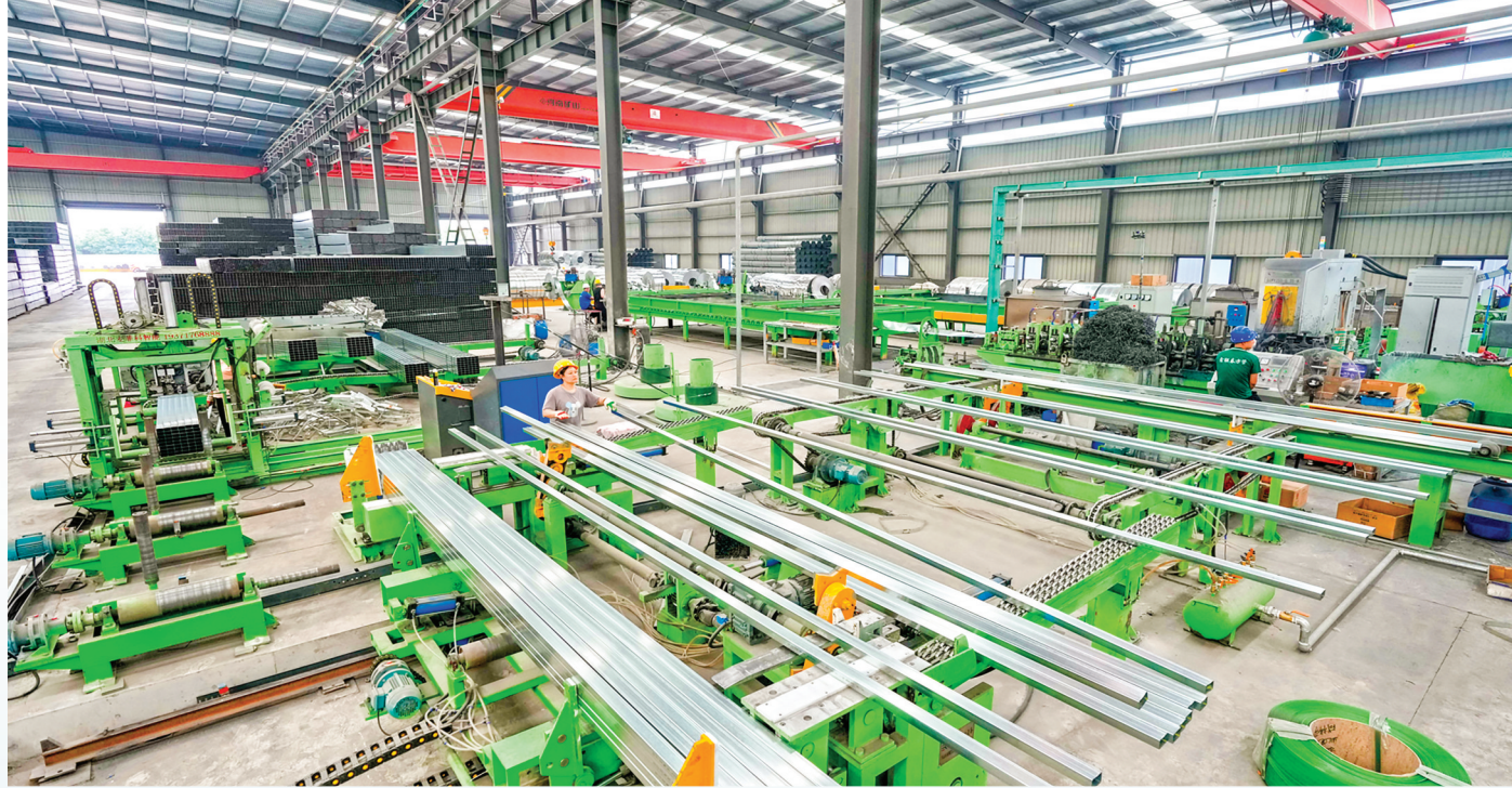
新绛县佰旺达金属制品有限公司年产10万吨金属方管生产线建设项目