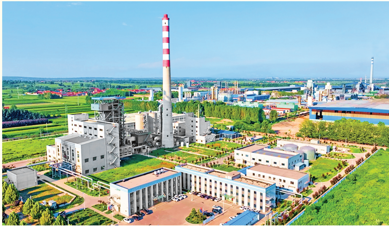
新绛县圣洁清洁能源有限公司热电联产项目

站在通通晋南智慧科技园的施工现场前，“新绛的综合优势让我们坚定了投资信心。”项目相关负责人指着规划图坦言，选址于此，看中的是这里“紧邻高速、辐射三省”的物流优势，其纵横交错的立体路网，叠加保税物流港，实现晋陕豫货物快速流转，而且依托本地蔬菜、水果产量大的优势，生鲜物流实现降本增效。此外，从土地审批到用工对接的全程护航政务服务为其提供了坚实后盾。当高效物流网匹配规模化农产品基地，再辅以专业化政策支持，5亿元智慧枢纽的落地成为多方优势聚合的必然选择。