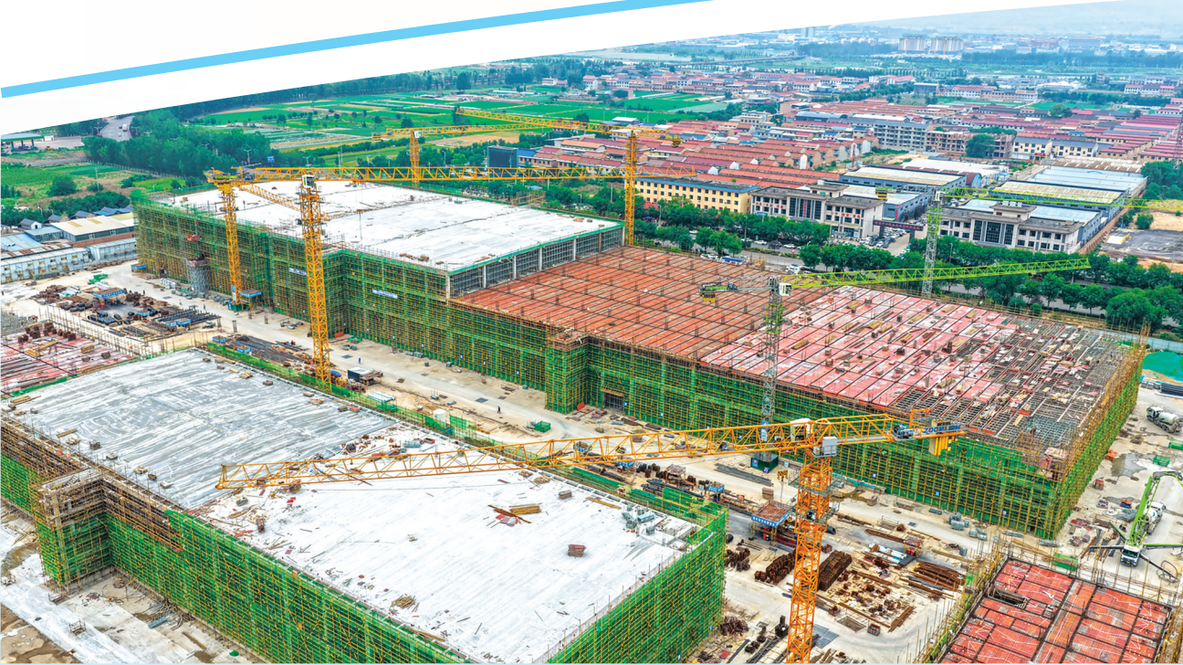
中通快递有限公司中通晋南智慧科技园项目