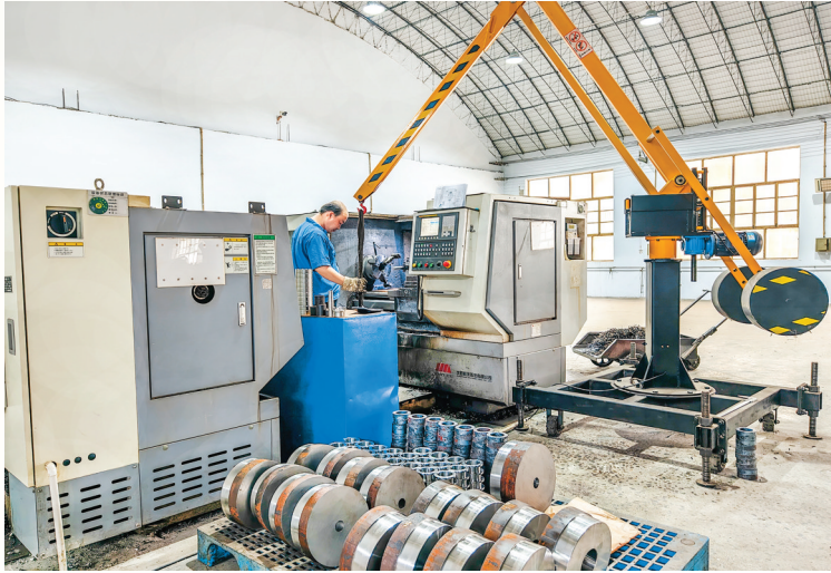
山西大新传动技术有限公司生产车间

从精钢淬火到良种破土，从化工新材到数智物流，新绛以“链式思维”集聚产业，以“金牌服务”滋养企业，以“创新融合”谋划长远，以“五区五城”建设为笔，饱蘸实干之墨，奋力书写打造产业转移优先承接门户的新新答卷。