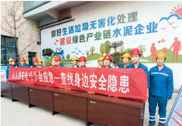
威顿水泥集团有限责任公司开展安全生产月活动