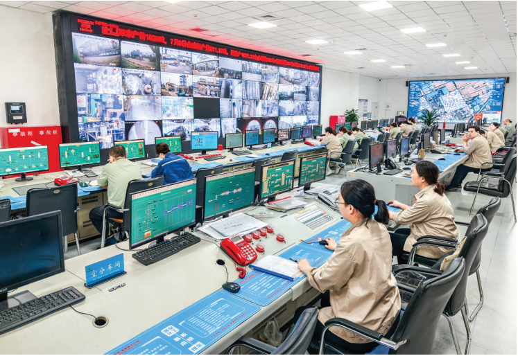
山西丰喜华瑞煤化工有限公司智能中控大厅