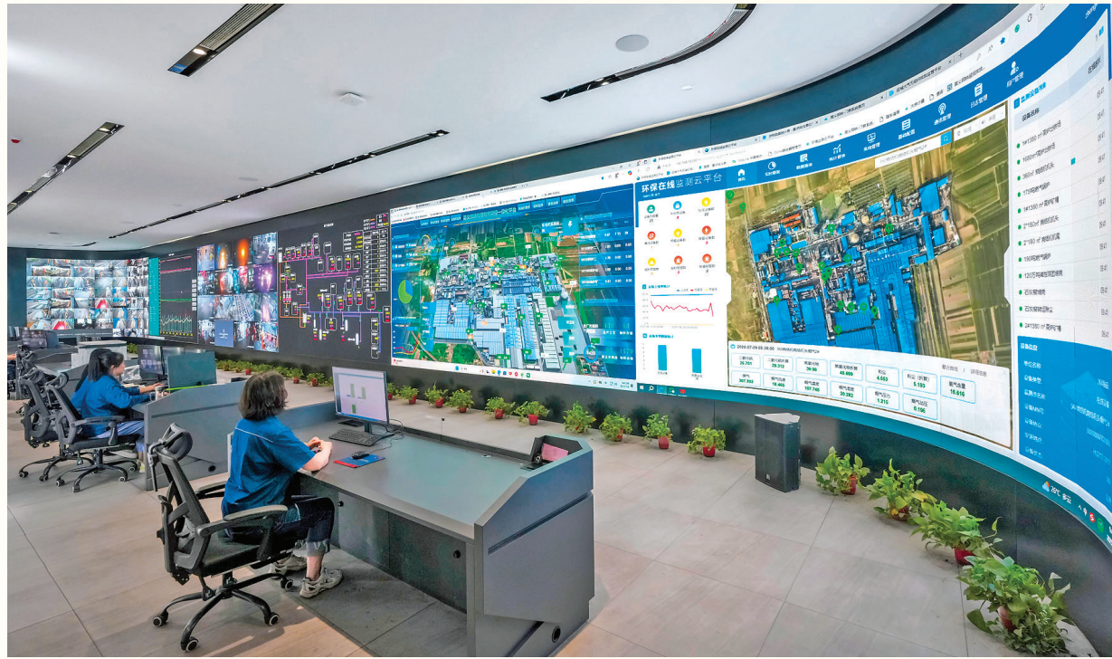
山西高义钢铁有限公司能源管控中心项目

新绛县坚持链式思维，依托多年深耕，产业链“强磁场”效应凸显，已锻造出四大硬核产业链。精品钢产业链以高义钢铁为引擎，重点对接推进山东冠县北鲁集团年产50万吨交通安全设施等项目。碳基新材料产业链以中信金石为核心，其150万吨优质冶金焦炭，配套干熄焦余热发电技术，年发电1.5亿千瓦时，吸引鑫鸿海肥业等就近取用焦化副产品硫酸铵，每吨成本可减少50元至100元。绿色建材产业链由行业标杆威顿水泥引领，其超低排放技术和协同处置危废能力，为装配式建材企业提供了绿色生产的典