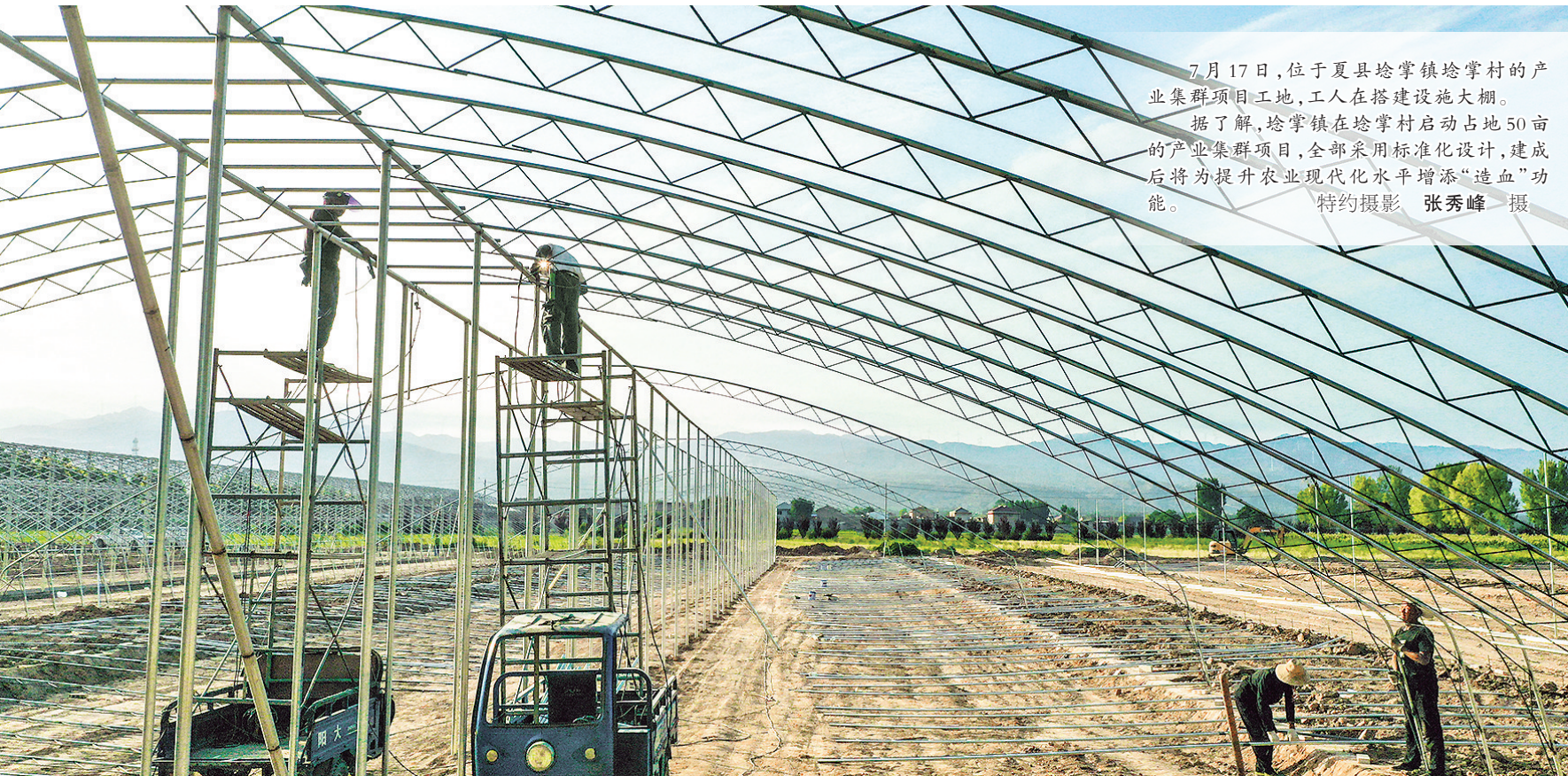
7月17日,位于夏县埧掌镇埧掌村的产业集群项目工地,工人在搭建设施大棚。据了解,埧掌镇在埧掌村启动占地50亩的产业集群项目,全部采用标准化设计,建成后将为提升农业现代化水平增添“造血”功能。

在随后召开的座谈会上,姚逊指出,近年来,国网运城供电公司始终践行“人民电业为人民”宗旨,充分发挥电力“先行官”作用,主动融入运城发展大局,以