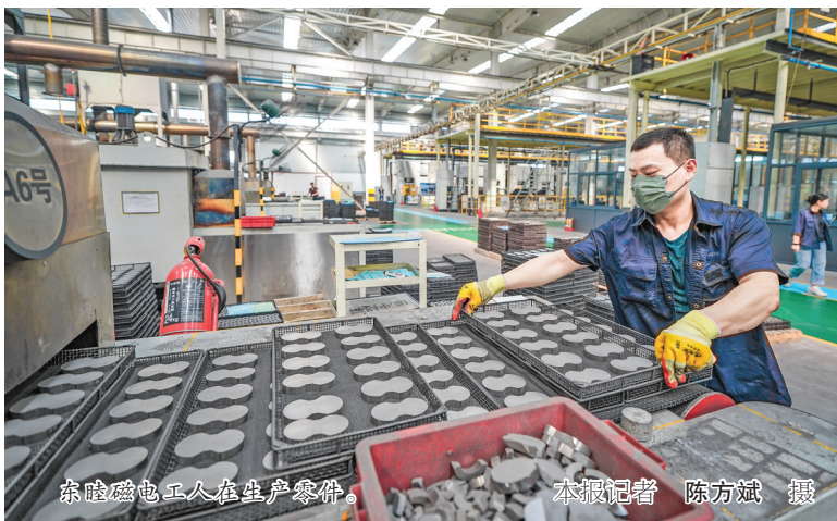
东睦磁电工人在生产零件。

东睦磁电是我市新兴产业的典型代表,也是我市建设现代化产业体系的重要成果。如今,作为全球屈指可数覆盖从软磁铁粉芯到高性能铁氧磁粉芯等全系列金属磁粉芯的行业领先企业,东睦磁电正在高性能软磁复合材料这一细分赛道上,引领着行业向高端化、智能化迈进。