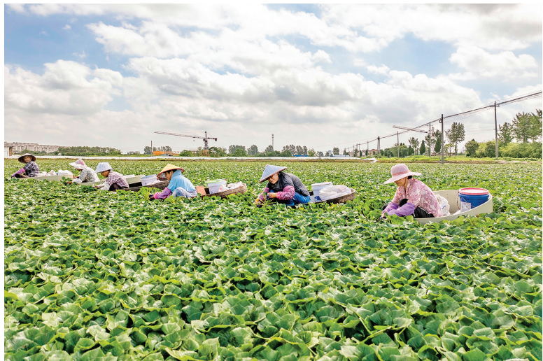
▲7月21日，村民在江苏省泰州市苏陈镇采摘菱角。眼下，多地菱角进入采摘期。菱农忙着采摘菱角，供应市场。

在她以及很多芜湖人看来，枫树下飞出的那只“海鸥”，早已化作万千形态“回家”：一座桥、一条路、一所学校、一群水鸟……这便是英雄最恒久的生命。（新华社合肥7月4日电）