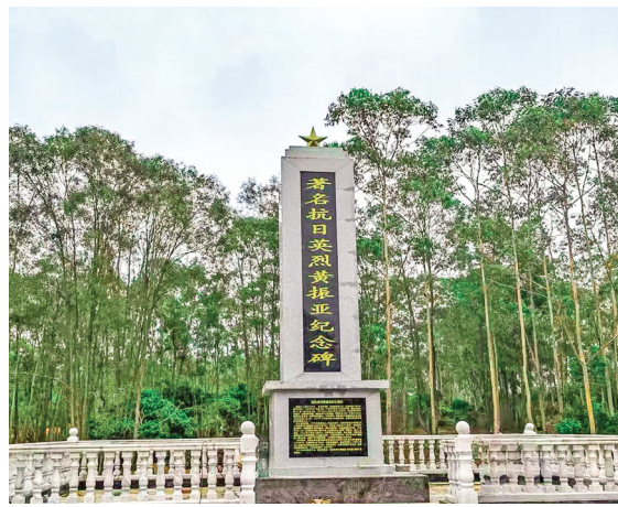
这是位于海南省儋州市海头镇的黄振亚烈士纪念碑（资料照片）。

海南岛西北，一方灰黑的火山岩砖静静躺在一个离海不远的村庄空地上。这是被熊熊战火吞噬后，抗日英烈黄振亚曾经住所遗留下的唯一印迹。85年前，琼崖抗日独立总队第三大队队长黄振亚，在一场与日寇的遭遇战中，血洒乡土，结束了短暂而壮烈的一生。