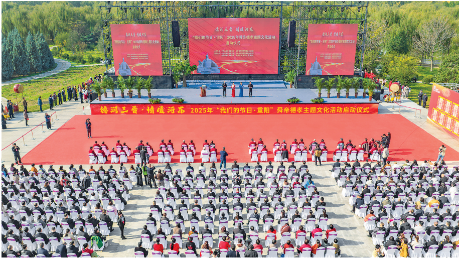
▲“我们的节日·重阳”2025年舜帝德孝主题文化活动启动仪式。