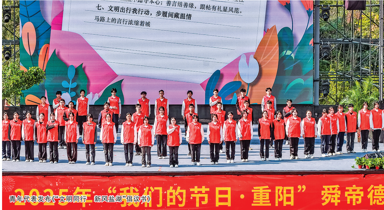
青年代表发布《“文明同行 新风盐湖”倡议书》