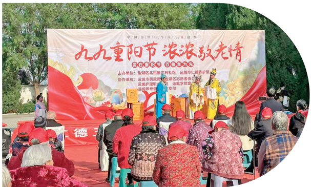
▲戏韵情深 润泽桑榆