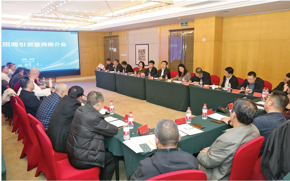
▶盐湖区招商引资宣传推介会。