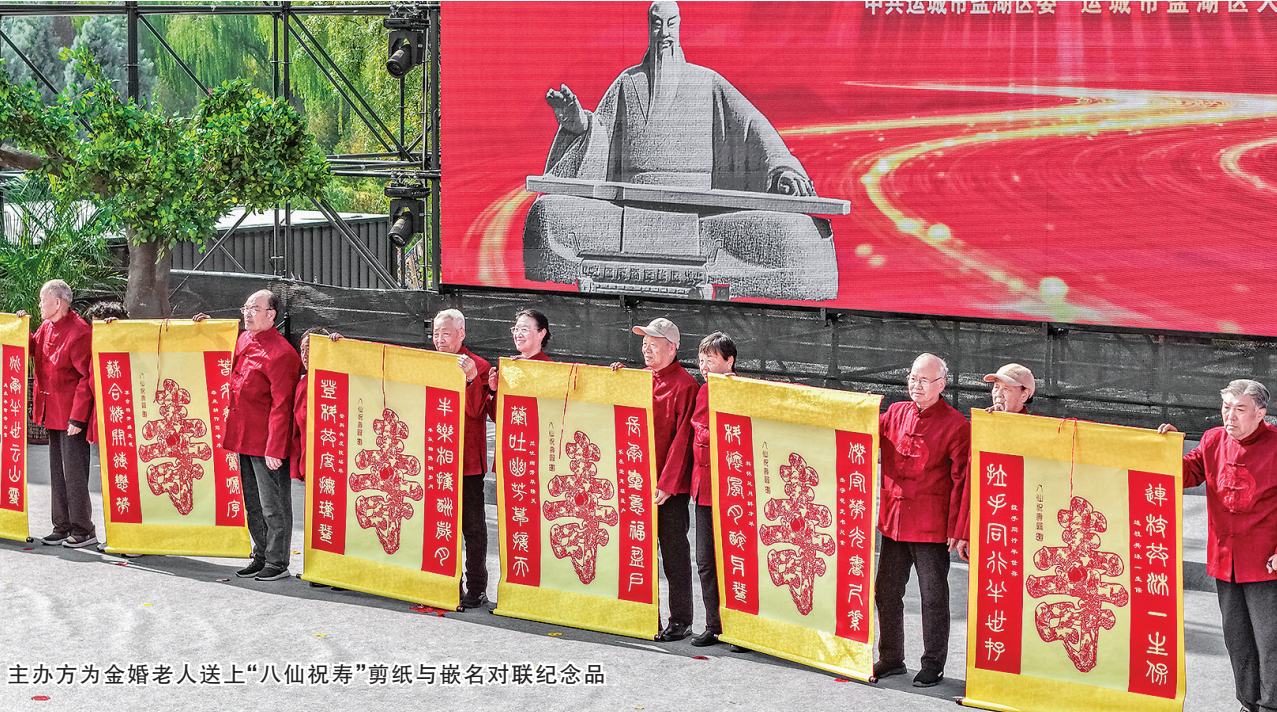
主办方为金婚老人送上“八仙祝寿”剪纸与嵌名对联纪念品