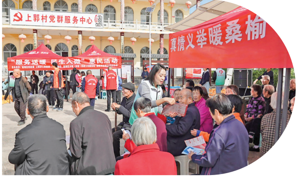
▲多元服务 细致入微