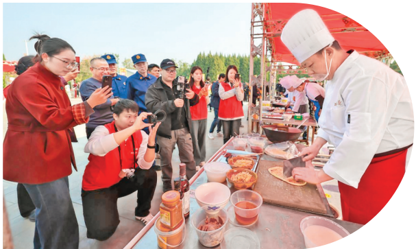
▲胡卜大赛 传承文化