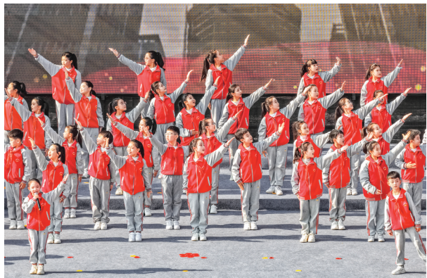
▲少年儿童用童声传递家风力量。

歌伴舞《我们的生活充满阳光》奏响幸福旋律,诗朗诵《德孝咏流传》追溯舜帝德孝文化与盐湖的历史渊源;少儿合唱《唱给爷爷的歌》用童声传递家风力量,情景表演《母亲》诠释女性在家庭建设中的奉献担当;青年代表发布的