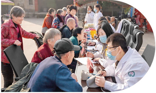
▲爱心义诊 守护健康