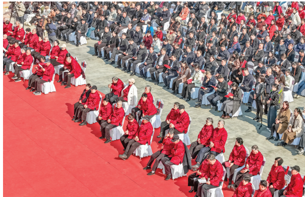
▲25对金婚老人参加舜帝德孝主题文化活动启动仪式。