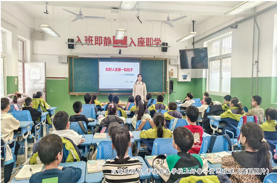
以党建统领，平陆县各学校上好每一堂思政课。(资料照片)