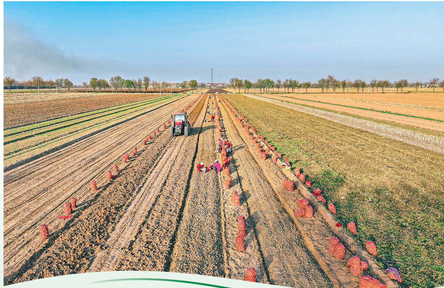
11月29日,万荣县荣河镇刘村村民在抢收地黄。

近年来,盐湖区始终坚持以农业增效、农民增收为目标,积极调整优化农业产业结构,大力引导群众发展红薯、果蔬等特色种植产业,不仅丰富了群众的“菜篮子”,更鼓起了农民的“钱袋子”。如今,像兴盛丰蔬果种植专业合作社这样的特色种植基地在盐湖区遍地开花,“甜蜜产业”正成为推动乡村振兴、带动农民增收的新引擎,为盐湖农业高质量发展注入了强劲动力。