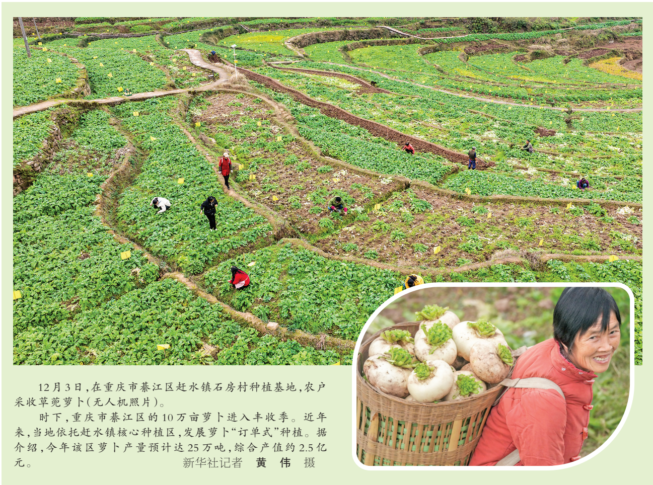
12月3日,在重庆市綦江区赶水镇石房村种植基地,农户采收茼蒿萝卜(无人机照片)。 时下,重庆市綦江区的10万亩萝卜进入丰收季。近年来,当地依托赶水镇核心种植区,发展萝卜“订单式”种植。据介绍,今年该区萝卜产量预计达25万吨,综合产值约2.5亿元。

行动方案还要求加密入境旅游航线。优化航权配置,引导中外航空公司针对主要客源国和新兴客源国,特别是共建“一带一路”国家,增开直飞航线航班,完善入境旅游航线网络。实施入境旅游航线推广计划,每年针对主要入境客源国、新兴客源国和入境旅游主要目的地城市重点培育打造一批入境游精品航线。