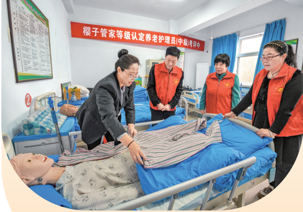
上图 山西樱子管家家庭服务有限公司的护理培训。