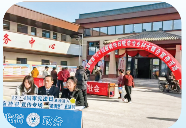
▲临猗县以“法治乡村大舞台”为主题，采用“线上+线下”联动模式开展法治宣传教育。