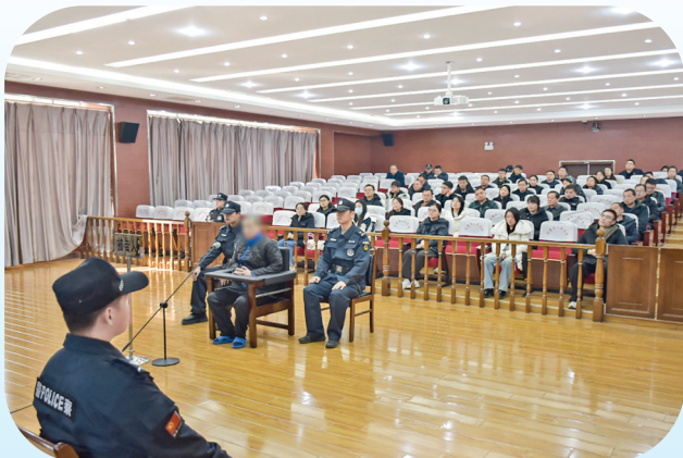
▲天津市人民法院邀请38家市直单位领导干部走进法庭旁听一起职务犯罪庭审。