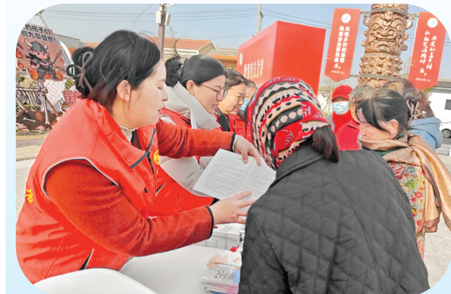
▲盐湖区妇联搭建宣传平台，为前来咨询的妇女群众现场答疑。

赵家庄派出所相关负责人表示，将持续深化联动协作，聚焦辖区企业生产经营中的高频纠纷类型，主动靠前提供法治服务，健全“一站式”纠纷化解渠道，以更高效的基层治理效能护航企业发展，为辖区经济高质量发展筑牢平安法治屏障。