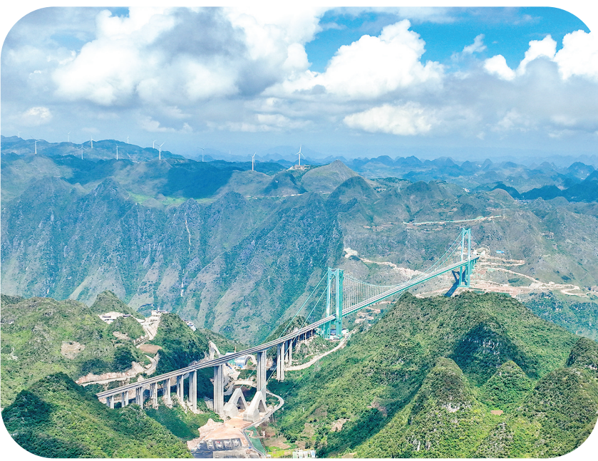
这是2025年9月28日拍摄的贵州花江峡谷大桥(无人机照片)。