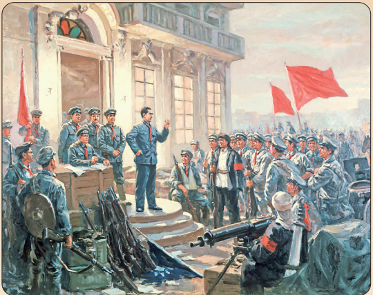
▲反映八一南昌起义的油画