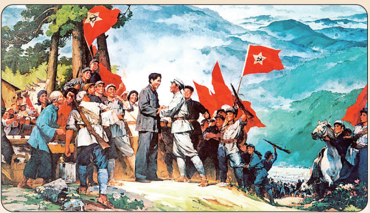
▲反映井冈山会师的油画