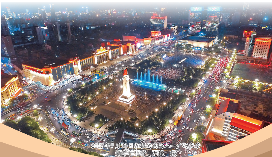
2017年7月30日拍摄的南昌八一广场夜景