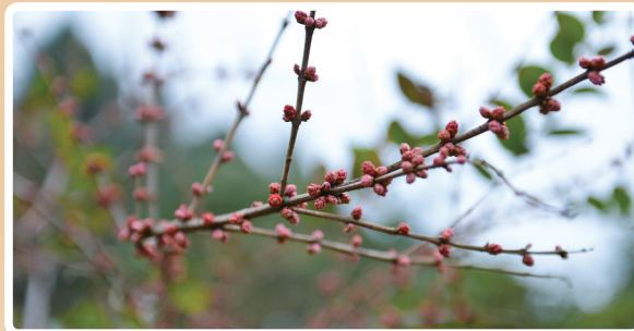
▲1月26日在湖南省张家界市桑植县拍摄的马桑树。