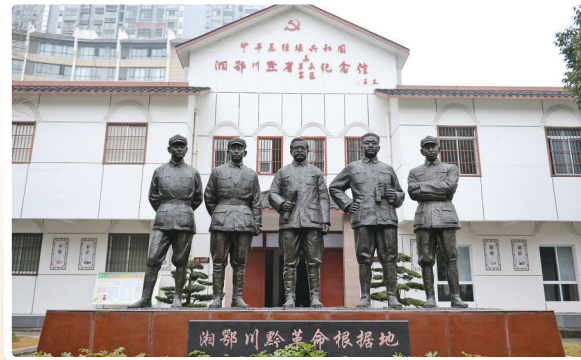
▲位于湖南省张家界市永定区的湘鄂川黔革命根据地纪念馆外景(1月27日摄)