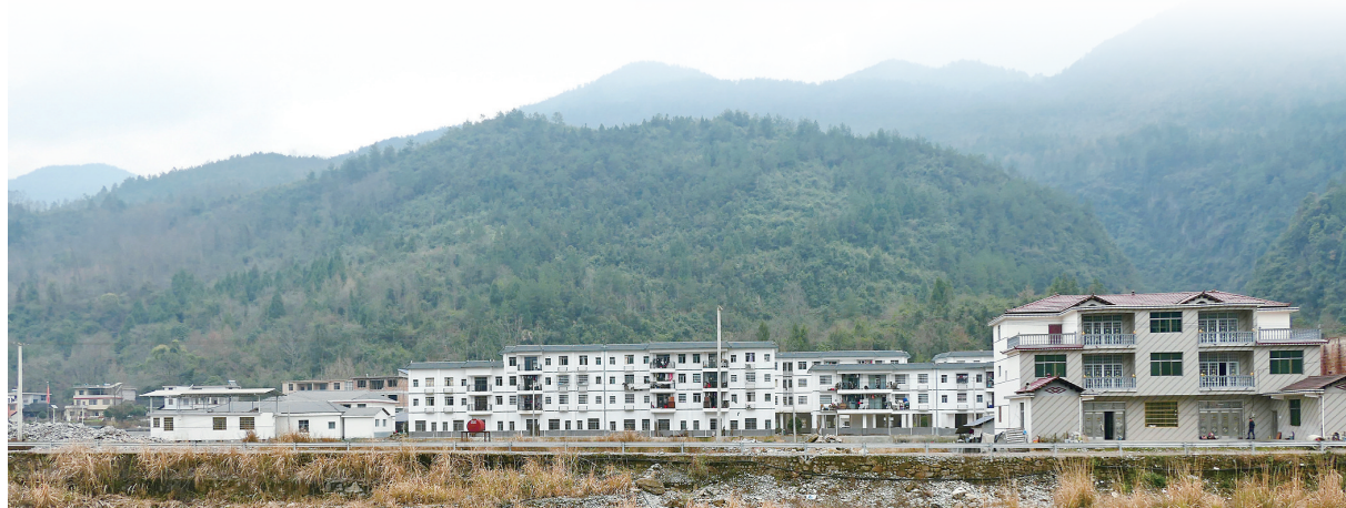
▲湖南省张家界市桑植县桥自弯镇一处易地搬迁扶贫安置点(1月26日摄)。2020年，桑植县建