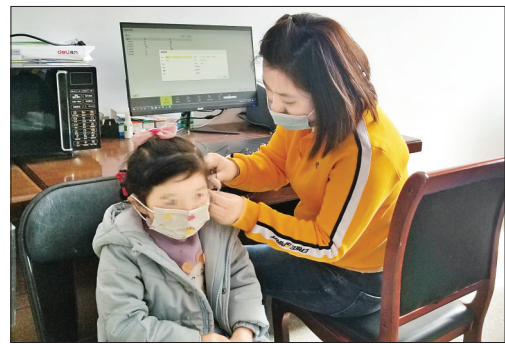
▲听力师为听障儿童调试助听器

市残联还推出“共同守护你的耳朵”有奖知识竞答活动,听障人士、听障儿童家长可关注“运城市残疾人联合会”微信公众号,在3月3日至3月13日期间参与有奖竞答。此外,市残联还在市区南风广场等处悬挂宣传横幅,通过线上线下多个渠道进行政策宣传;组织相关康复机构为有需求的人员免费进行听力检测、助听设备调试和保养,提供政策咨询、义诊等服务。