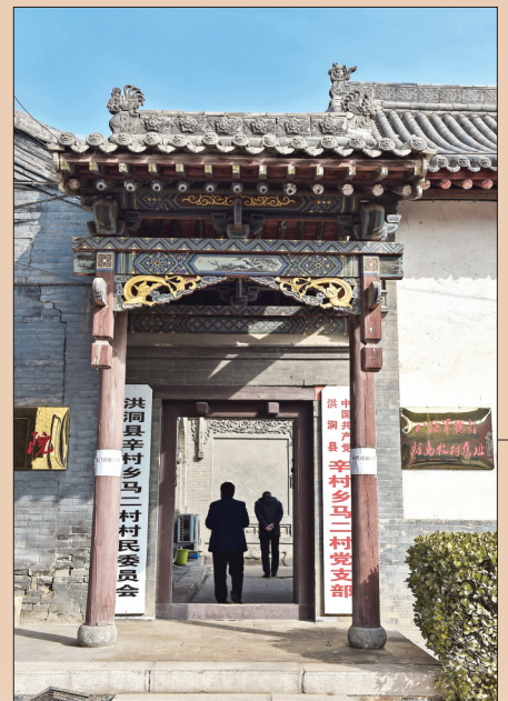
▲位于山西省洪洞县辛村乡马二村的八路军总部驻马牧村旧址(1月26日摄)