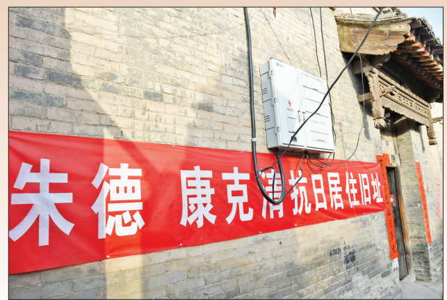
▼位于山西省洪洞县万安村的朱德、康克清抗日居住旧址(1月26日摄)