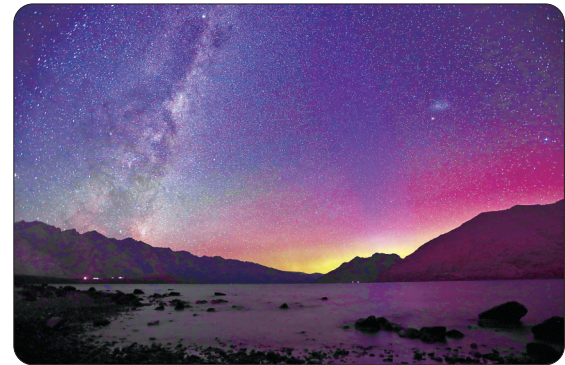
▲这是3月20日在新西兰南岛昆斯敦拍摄到的极光。

国际知名微生物和免疫学专家理查德·斯特拉格内尔在同期《柳叶刀》上撰写述评指出,该研究使人们对大流行城市人群自然血清阳转情况有了更深入的了解,是描述新冠病毒感染和理解大流行下免疫状态的重要里程碑。