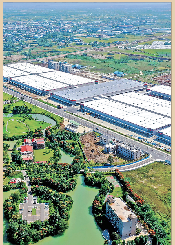
▲位于广汉工业集中发展区的京东西南智能运营结算中心(2020年9月17日摄,无人机照片)