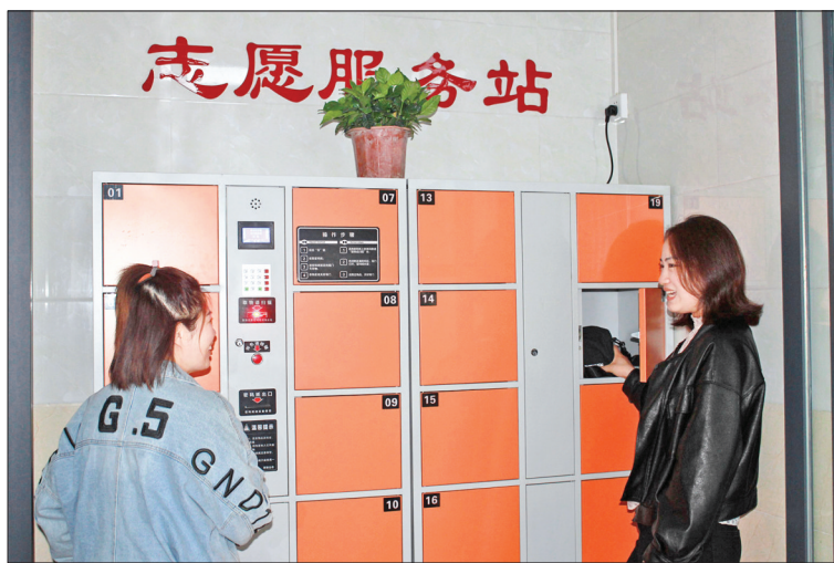
▲市民将物品存放在便民服务柜

人民至上是政治立场,民生是最大的政治。蒲园——该市的首个“党建文化园”内便民储物柜安装到位、南城粮贸城市服务站——我市首个“党群城市服务站”党史学习教育120本书籍已放置到位,“五大公园”增设乒乓球台7个、健身器材12套……市民在游园锻炼之余,既能