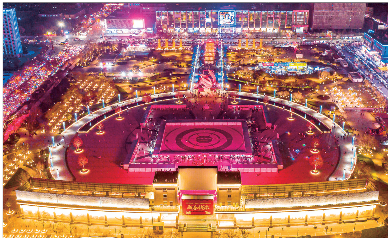
▲《流光溢彩》组照之一