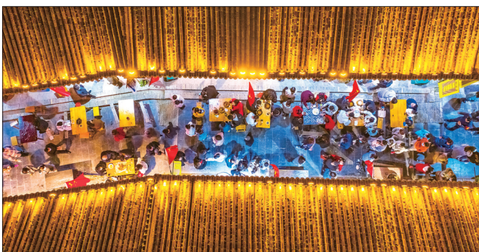
▲《岚山根·运城印象年味浓》组照之一