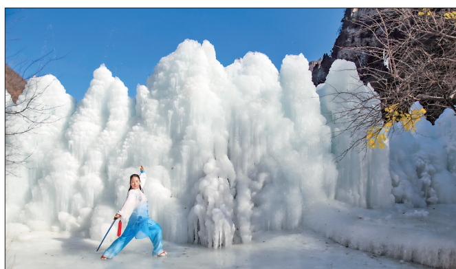
▲《五老峰冰挂》组照之一