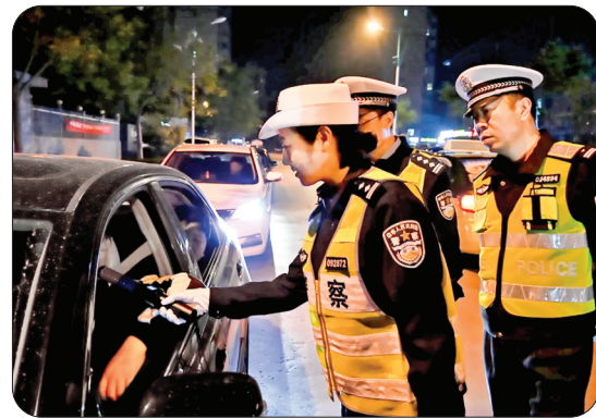
▲垣曲交警大队联合交警支队夜查酒驾

安局交警支队直属大队开展夜查行动。行动中,联合执法小分队采取定点执勤与流动巡逻相结合方式,做到逢车必查,对过往车辆驾驶人逐一进行吹气式酒精检测。