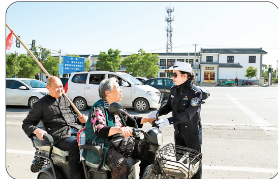
▲交警支队下沉民警在解放路延长线劝导交通陋习