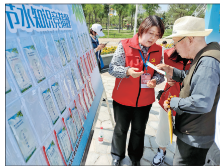
▲ 市民参与节水知识竞猜