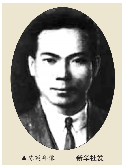
▲陈延年像

行委员会委员，负责《少年》月刊编辑工作。1922年秋，他加入法国共产党，不久转为中国共产党党员。