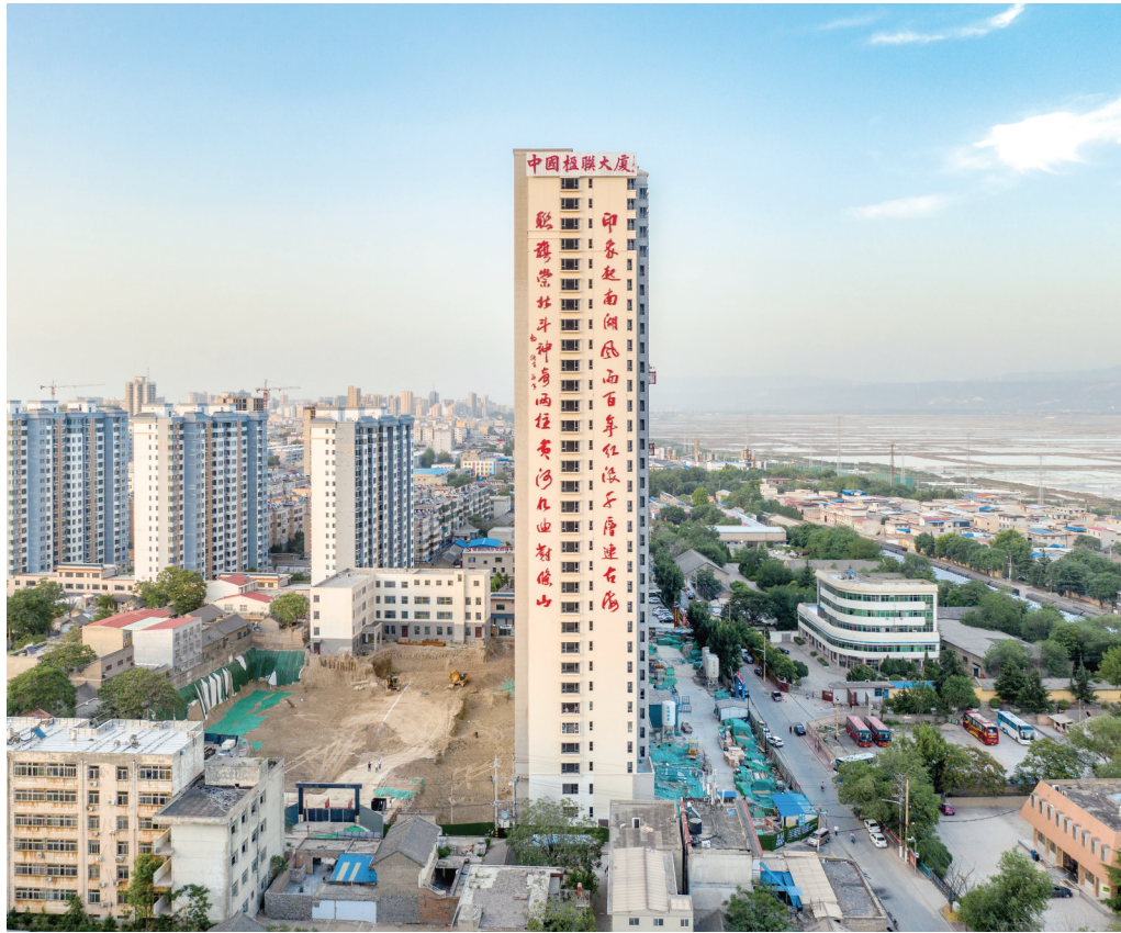
中国楹联大厦外观