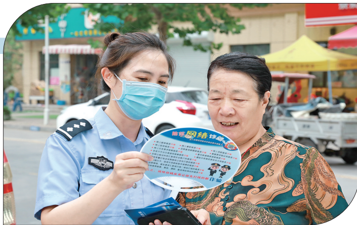
▲民警向市民宣传“防范网络诈骗”相关内容

运城移动分公司建立号码入网信用体系管理手段,对涉及诈骗等违法情况的入网用户进行黑名单管理,及时处置涉案号码、高危号码。今年以来,该公司共添加黑名单证件200余个;关停公安部通报涉案号码、工信部平台被举报号码及同证件下号码共820户;回访核查3994户高频通话用户和27111户潜在风险用户。