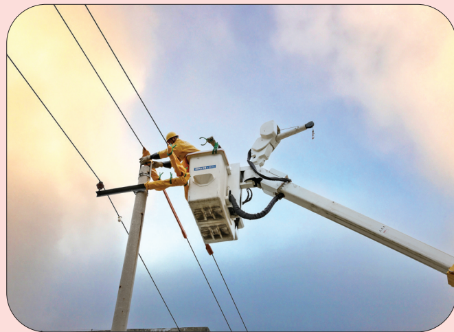
▲绝缘斗臂车、绝缘服双重保障

面对高温作业,他们的安全措施如何?连日来,记者先后走进电力工人、建筑工人和消防指战员工作现场,了解其高温及高空作业条件下的“安全感”。