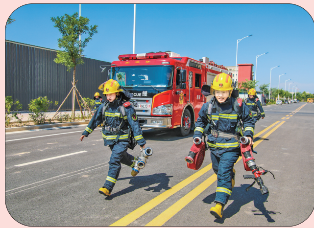
▲每人配备近40公斤的装备