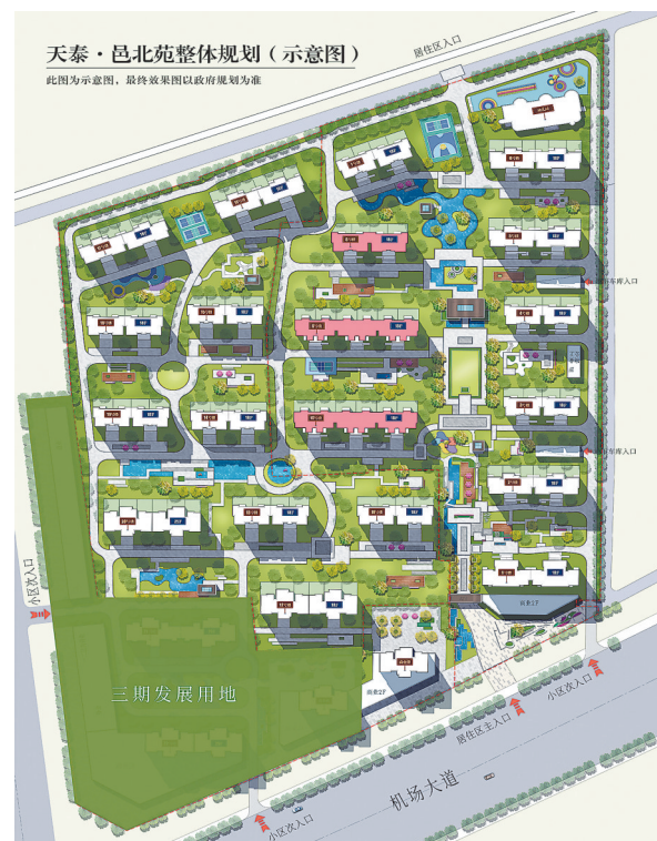
天泰·邑北苑整体规划(示意图)