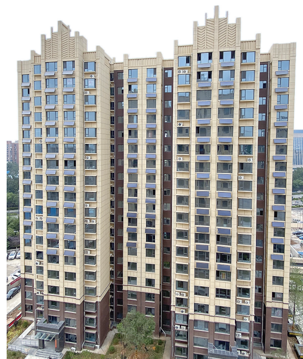
小区临街立面实景图