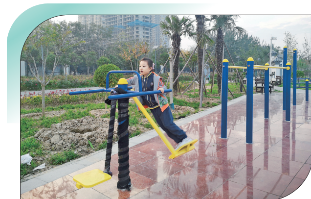
▲市区禹都公园，小朋友在使用健身器材。

该公园相关负责人介绍，由于疫情防控原因，目前，该展览馆暂时不能对外开放。待展览馆对外开放后，欢迎广大市民前来体验。