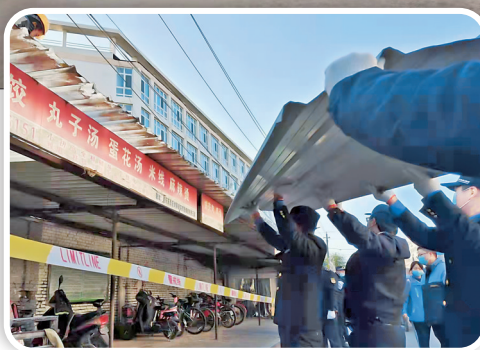
▲整治后的西城农贸市场